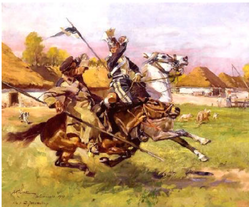
Войцах Косак. Улан супраць казака - эпізод Лістападаўскага паўстання.

1 200 чалавек). У той жа дзень камандзір паўстанцаў Ігнат Станевіч сабраў некалькі тысяч чалавек і рушыў у Эйраголу насустрач Барталамею, аднак 31 сакавіка паўстанцы былі разбіты, частка аддзела разбеглася ў розных кірунках а частка адступіла. Барталамей заняў Расіены. Аднак ён не змог доўга ўтрымацца ў Расіенах, пакінуў горад, быў прысунуты інсургентамаі да мяжы з Прусіяй і праз некаторы час са сваім атрадам інтэрнаваны ў Прусіі.