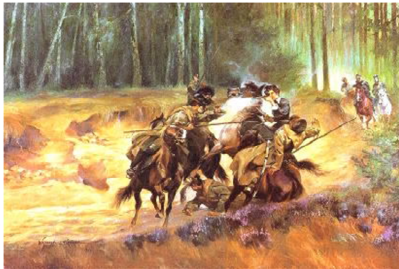
Войцах Косак. Эмілія Плятар у бітве пад Шаўлямі.