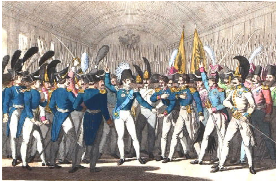
Мікалай I інфармуе двор аб паўстанні 1830 г.

Напад на Бельвядэрскага палаца быў даручаны Людвіку Набяляку з курсантам школы падхарунжных. Высоцкаму і Урбінскаму было даручана арыштаваць рускіх генералаў і афіцэраў, ксяндзу Бранікоўскаму – звярнуцца да народа ў горадзе.