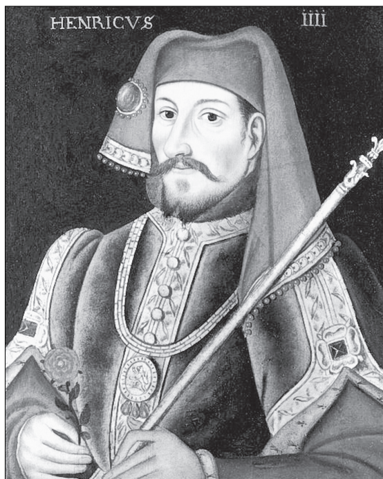
Генрых IV Балінброк, малюнак XVI ст.

6 верасня пачаўся агульны штурм падпаленага горада. Верагодна, прыхільнікі Вітаўта адчынілі браму горада, і непрыяцель уварваўся ў яго, забіваючы ўсіх. Ян Длугаш (1415—1480), польскі гісторык, лічыў, што галоўнай прычынай падзення добра ўмацаванага горада была здрада. Длугаш пісаў: «...попымя з-за варожага прыступу нельга было спыніць, князь Казімір, інакш Карыгайла, родны брат польскага караля Уладзіслава, кідаецца ўцякаць з агню, але трапляе жывым у рукі ворагаў, якія ў вялікім мностве атачалі падпалены замак, і адразу ж падае абезгалоўлены; насадзіўшы галаву забітага на доўгую дзіду, ворагі паказваюць яе для застрашвання абаронцаў Верхняга замка, пераконваючы іх здаць замак».