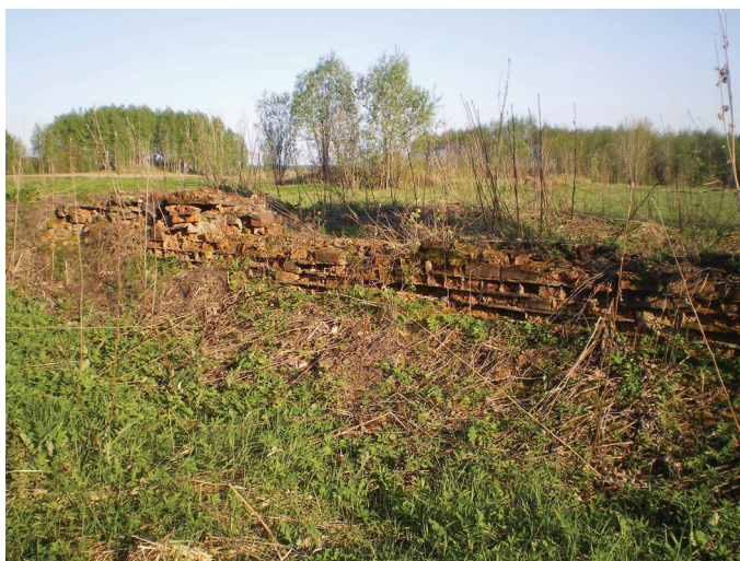
Ілл. 2. Падмурак сядзібы Заблоцкіх-Розэнаў у Мікалаеве (2011)