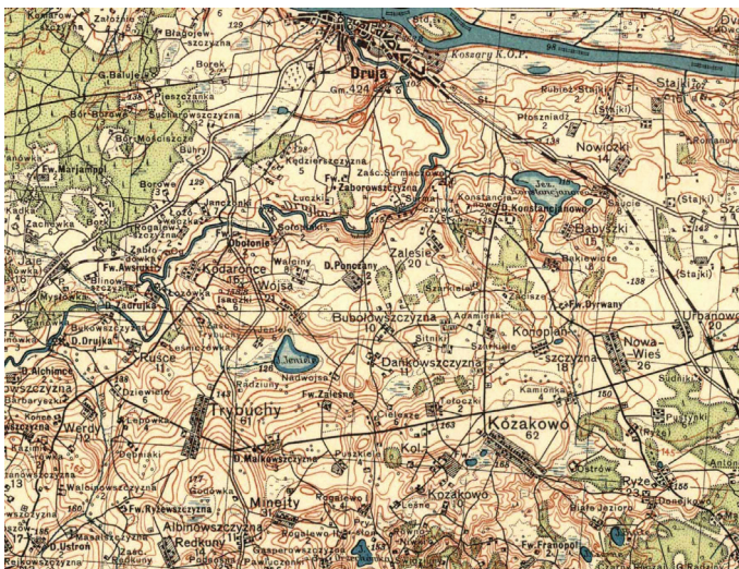
Илл. 3. Мапа наваколля Панчанаў і Друйкі (1932)