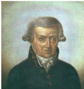
Малюнак 1. Ёган Хрыстаф Броце. Партрэт невядомага мастака пач. XIX ст.

На сённяшні дзень матэрыялы калекцыі складаюць розныя архіўныя фонды Латвіскага Дзяржаўнага Гістарычнага Архіва ў Рызе, але фарманне ядра гэтай былой калекцыі і яго размеркаванне па сучасных фондах