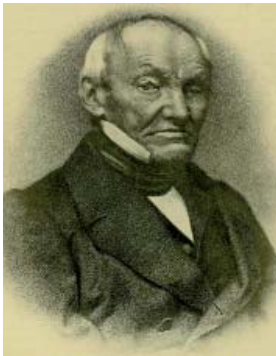
Малюнак 10. Петэр фон Кёпен (Пётр Кепен), расійскі гісторык, дэмаграф і статыстык, даследчык помнікаў старажытнарускага пісьменства (наводле: [4]).

Можна канстатаваць, што Ёган Хрыстаф Броцэ стаў першым даследчыкам, які пачаў сістэматычна вывучаць рыжскія архіваліі, у тым ліку і кірылічная граматы XIII–XVI стст. Пры далейшым выданні і вывучэнні матэрыялаў калекцыі Moscowitica-Rithenica неабходна ўлічваць творчую і навуковую спадчыну Ё.Х. Броцэ.