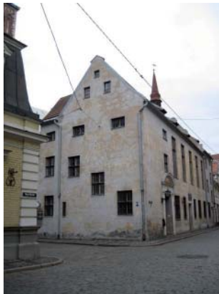
Малюнак 3. Будынак Імператарскага ліцэя ў Старой Рызе (здымак жніўня 2012 г.).

Гэтая калекцыя змяшчае 10 тамоў у скураных вокладках кожны з якіх складаецца з 2–3 частак (3246 аркушаў фармату 33 x 21 см). Сёння калекцыя захоўваецца ў Латвійскай Акадэмічнай Бібліятэцы [1, Nr. VM01000A – VM10214B.]. Большасць малюнкаў калекцыі ўяўляюць сабой арыгіналы, але ёсць таксама планы і малюнкi, выкананыя іншымі мастакамі і скапіяваныя Броцэ. Шмат арыгінальных малюнкаў Броце