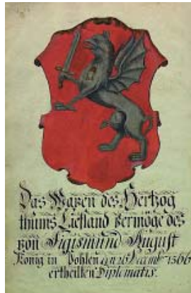
Малюнак 6. Прыклад капіявання Броцэ гербоў: герб Инфлянтаў, дараваны Жыгімонтам Аўгустам у 1566 г. ( Das Wapen des Hertzogthums Liefland ... [das Wappen]. (Sammlung verschiedener Liefländischer Monumente. V. 1, T. 1. Nr. 5 [1, BM01000G]).

Цікаваць Петэра фон Кёпена, вядомага яшчэ таксама як Пётр Іванавіч Кёпен (Петр Иванович Кёппен/Кеппен, 1793–1864), да працы Броцэ не была выпадковай. Кёпен сам займаўся вывучэннем крыніц