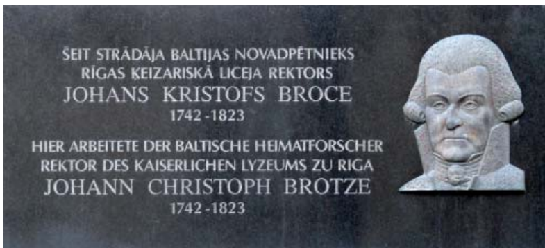
Малюнак 4. Памятная шыльда ў гонар Броцэ на будынку Рыжскага Імператарскага ліцэю.

У чарцяжах і малюнках Броцэ маюцца апісанні гербоў балтыйскага дваранства, пячаткі і помнікі Рыжскіх арцыбіскупаў, біскупаў, гарадоў, судоў, а таксама надпісы на надмагіллях, будынкi, званы, кубкі і іншыя рэчы, краявіды маёнткаў, замкаў, гарадоў і пасёлкаў, грамадскіх будынкаў, жылых дамоў, сабораў, а таксама тапаграфічныя карты розных месцах, выявы жыхароў гарадоў і сельскай мясцовасці, іх адзенне, адлюстраванне ладу жыцця і працы, арганізацыі працоўнага працэсу, рознага тэхнічнага абсталявання (напрыклад, водазабеспячэння). Тут можна знайсці выяўленчую і тэкставую інфармацыю пра многія латвійскія і эстонскія гарады. Увогуле, гэта было характэрным для стылю працы Броцэ – сабраць, па магчымасці, як мага больш інфармацыі пра нейкі канкрэтны аб’ект ці горад. Каб паказаць гісторыю паселішча ў развіцці, сабраныя за розныя гады планы Броцэ суправаджаў малюнкамі найбольш значных будынкаў горада, даваў сваё гістарычнае апісанне, эканамічныя і адміністрацыйныя характарыстыкі. Яшчэ пры сваім жыцці Броцэ пачаў выдаваць матэрыялы сваіх краязнаўчых пошукаў, дапаўняючы іх звесткамі па тапаграфіі і дэмаграфіі Ліфлянтаў [35]. Але, тым не менш, абсалютная большасць творчай спадчыны Броцэ заставалася не апублікаванай, хоць даследчыкі вельмі шчодро карысталіся з набыткаў рыжскага збіральніка. Праўда, у азначэнне заслугаў Броцэ для Рыгі і Ліфляндскага краю ў 1815 г. была выдадзеная яго біяграфія [28].