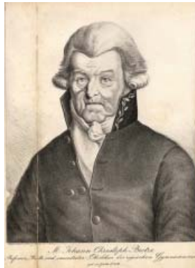
Малюнак 2. Партрэт Ёгана Хрыстафа Броцэ – прафесара, радцы і старшага настаўніка Рыжскай гімназіі на пенсіі, уроджанага ў Горліцу ў 1742 г.

Сёння імя Броцэ па-ранейшаму фігуруе ў даведніках, як выдатнага нямецкага педагога і этнографа. Апошнія сваё вызначэнне Броцэ атрымаў таму, што дзякуючы сваім здолнасцям зацікаўленага назіральніка і таленавітага мастака, ён пакінуў вялікую колькасць малюнкаў, на якіх адлюстраваны штодзённае жыццё і тыпажы жыхароў тагачаснай Ліфляндыі. Сабраныя Броцэ матэрыялы дапамагаюць зразумець лад жыцця, народныя звычаі і культуру Ліфляндыі XVIII ст. Але і даўняя гісторыя Інфлянтаў і Рыгі абуджалі цікавасць нямецкага даследчыка.