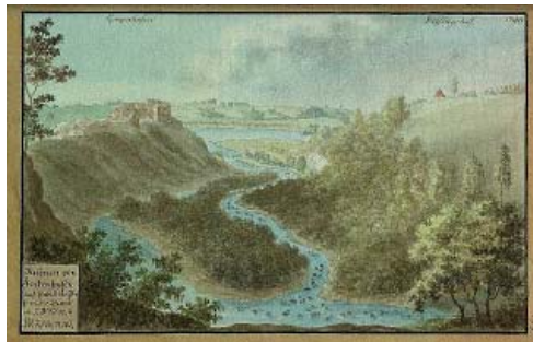
Малюнак 7. Прыклад адлюстравання Броцэ гістарычных ландшафтаў: руіны замка Кокенгузен пры ўпадзенні ракі Персы ў Дзвіну, 1796 г. Даўні полацкі фармаст ( Ruinen von Kockenhusen und Einfall der Perse in die Düna 1796 [die Ansicht] ). ( Sammlung verschiedener Liefländischer Monumente . V. 7, T. 3. Nr. 266 [1, BM07199A]).