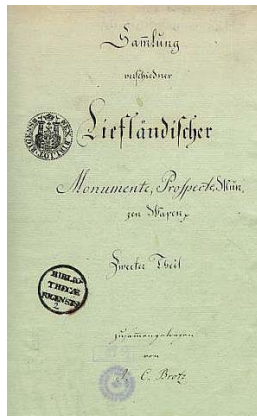
Малюнак 5. Тытульны аркуш тому 2, часткі 1 “ Sammlung verschiedener Liefländischer Monumente, Prospective, Münzen Wapen etc. ” Zweiter Theil zusammengetragen von J. C. Brotz [Bibliothecae Rigensis 2]. ( Sammlung verschiedener Liefländischer Monumente. V. 2, T. 1. Nr. 2 [1, BM02000B]).

Практычна адначасова, як мяркуе латвійская даследчыца Аяя Тайміня [40, S. 120], са складаннем кодэксу “ Sylloge diplomatum Livoniam illustrantium ” Броцэ падрыхтоўваў копіі дакументаў для іншага свайго сістэматызаванага збору крыніц – “ Diplomata Rigensia descripta ”.