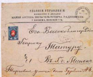
Лл. 2. Канверт ліста Ежы Гутэн-Чапскага да Генрыха Татура з пазначэннем адраса апошняга:

«Мінск, [вул.] Гандлёвая, № 8», 7 верасня 1895 г., Прылуки