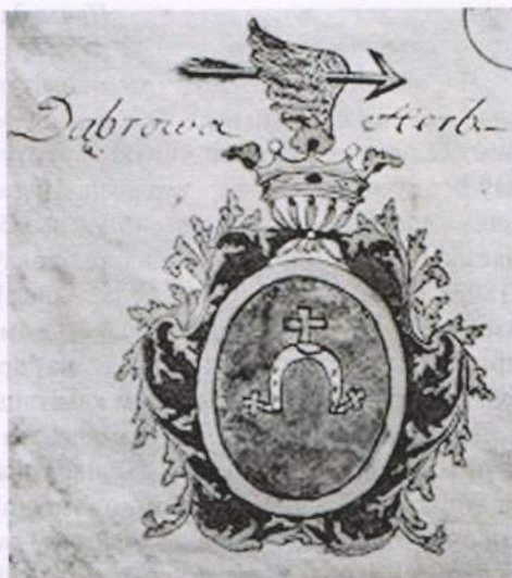
Іл. 1. Герб роду Татураў «Данброва»

Генрых Франц Татур нарадзіўся ў Слуцку 17 верасня 1846 г. 4 і спачатку меў усе шансы пабудаваць нармальную кар’еру шляхціца паяволнага краю. Род Татураў пасля падзелаў Рэчы Паспалітай змог прадставіць усе паперы, каб засведчыць сваё шляхецкае паходжанне і быў прызначаны ўжо ў расійскім дваранстве: Мінскі дваранскі дэпутацкі сход 2 сакавіка 1802 г. і 24 студзеня 1808 г. прызнае род Татураў гербу «Дуброва» («Данброва»). У сваю чаргу, гэтыя рашэнні былі зацверджаны ўказамі Сената ў 1849 г. і 1861 г. 5