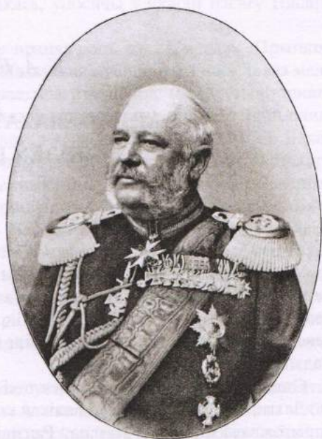
Іл. 8. Князь Антоні Вільгельм Радзівіл

Сёння мы можам сцвярджаць, што ў той сітуацыі нявызначанасці і торгаў асноўная частка музейных каштоўнасцяў Татура сапраўды патрапіла тады ў Львоў у мяркуемы музей Уніі, які ствараў мітрапаліт Шаптыцкі 22 , а частка бібліятэкі і рукапісаў — да Тышкевічаў пад Вільню, а потым і ўласна ў Вільню.