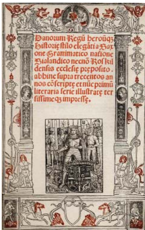
Малюнак 2. Тытульны аркуш першага выдання « Gesta Danorum », ажыццёўленае Крысціерам Педэрсанам (Парыж, 1514)

Мова пойдзе ўжо пра лацінамоўную «Гісторыю данаў» (« Gesta Danorum ») дацкага храніста другой паловы XII ст., вядомага як Саксон Граматык (памёр пасля 1208 г.). Уласна прыдымак «Граматык» яму было дадзена ўжо ў XIV ст. у знак прызнання ягонага стылістычнага майстэрства – лаціністы адзначаюць несумненны мастацкі і моўны талент аўтара «Гісторыі данаў». Хутчэй за ўсё, ён атрымаў адукацыю па-за межамі Даніі, магчыма ў Францыі, дзе квітнелі традыцыі лацінскай адукацыі. Але пра біяграфію самога Саксона сцвярджаць што-небудзь пэўнае немагчыма. Непасрэдна ў сваім тэксце аўтар прыгадвае, што ягоныя дзед і бацька служылі ў войску караля Вальдэмара I, а сам Саксон быў ужо на службе, не ваеннай, у Вальдэмара II. Часам гісторыкі называюць яго дарадцам і капеланам караля.