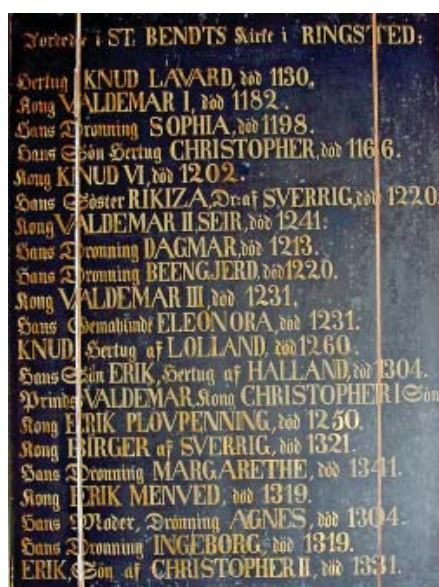
Малюнак 4. Табліца з сабора Св. Бенедыкта ў Рынгстэдзе з указаннем імёнаў пахаваных тут манархаў. Апроч Вальдэмара I і Сафіі тут адзначаны імёны іх сыноў каралёў Кнуда VI і Вальдэмара II, а таксама дачкі, каралевы шведскай Рыксы (Рыкізы)

(1086–1138). У выніку гэтага шлюбу была аформлена даволі разнародная кааліцыя – саюз Баляслава III з князямі Полацкай зямлі супраць дацкага караля Эрыка II (каля 1090 – 1137) і яго хаўруснікаў – спадкаемцаў Уладзіміра Манамаха, князёў кіеўскіх і наўгародскіх. Што звязвала дацкага караля і Манамахаў? Рэч у тым, што Эрыка II быў жанаты на Мальфрызе Мсціславаўне, дачцы кіеўскага князя Мсціслава Уладзіміравіча (1076–1132), вядомага таксама як Гаральд. Польскага і полацкіх жа князёў звязалі іх супярэчнасці з Даніяй і Кіевам, адпаведна. Палітычныя змены і смерць некаторых з галоўных суб'ектаў гэтага саюзу (Эрыка II і Баляслава III) прывялі да распаду гэтай складанай палітыка-матрыманіяльнай камбінацыі, а потым і самога шлюбу [25, с. 262–263]. У канцы 1140-х гг. Рыкса развялася з Валадаром, а затым узяла новы шлюб з аўдавелым шведскім каралём Сверкерам. Зрэшты, яшчэ да шлюбу з Валадаром Глебавічам Рыкса ўжо была замужам за Магнусам Моцным, сынам дацкага караля Нільса. Шлюб гэты, дарэчы, і даваў падставы Баляславу III умешвацца ва ўнутрыдацкія справы. Але ж палітычны і сямейны саюз Рыксы і Валадара Глебавіча таксама даў плён – каля 1140 г. у іх нарадзілася дачка Сафія.