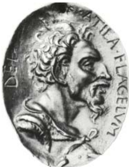
Малюнак 1. Рэнесансны бронзавы медаль з легендаю « Atila, Flagelum Dei » («Атыла, біч Божы»). Рэпліка XV ст. з ранейшага арыгіналу. Луўр (Department of Decorative arts, Richelieu, OA 2432)

Самыя архаічныя звесткі, вядома, у трансфармаваным выглядзе, захоўвае «Сага пра Тыдрэка Бернскага». Вандраванні на працягу стагоддзяў гэтага легендарнага героя праз эпас розных германскіх народаў здольныя захапіць розум. Гэтым разам скандынаўскі герой знаходзіўся ў войску гунскага правадыра Атылы, які: