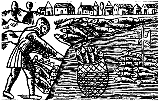
Лоўля сялядцоў у Скандынавіі. Гравюра з кнігі Олафа Магнуса «Historia de Gentibus Septentrionalibus» («Гісторыі наўначных народаў»), 1555