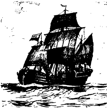
Галандскае рыбацкае судна (buise) XVII ст. Галандскія рыбакі лавілі сялядцоў на дрыфтэрах (парусніках, якія пасля пастановкі сетак маглі свабодна плаваць). Па-галандску яны называліся «buise»