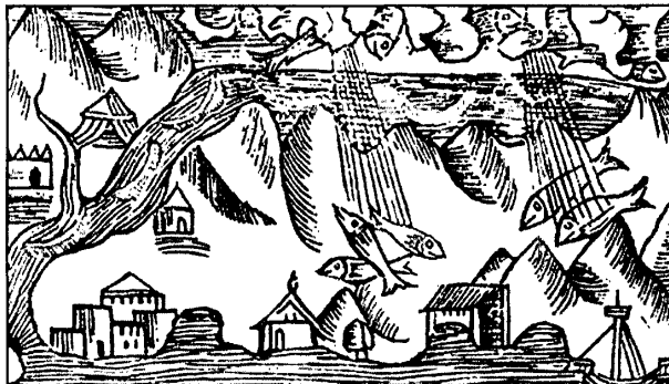
Гравюра «Рыбны дождж». Олаф Магнус, «Гісторыі паўночных народаў», 1555

зе, дзе вядлілі селядцы, працаваў бацька Марка Шагала, а ягоная маці ўтрымлівала ўласную крамку, дзе прадаваліся тыя самыя селядцы. Развітваючыся з родным Віцебскам, вясною 1907 года Марк Шагал напісаў у сваім дзённіку: «Бывай, Віцебск! І вы — заставайцеся вы тут з вашымі бочкамі, з вашымі селядцамі... землякі!» 8