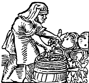
Селядзяр (паводле кнігі Якуба Гаўра «Skład або skarbiec znakomitych sekretów oekonomiej ziemiańskiej», Кракаў, 1693)

сямейства селядцовых, падвід селядзец атлантычны. Салака мае даўжыню да 20 см, масу — да 75 гр. Салака — асноўная прамысловая рыба Балтыйскага мора. Таму праўдападобна, што віцябляне выставілі рыжанам прэтэнзіі акурат праз якасць засоленай салакі.