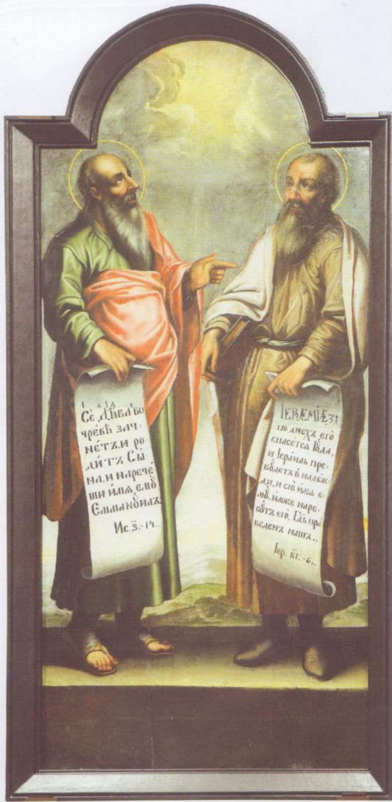
Прарокі Ісая і Іерамій.