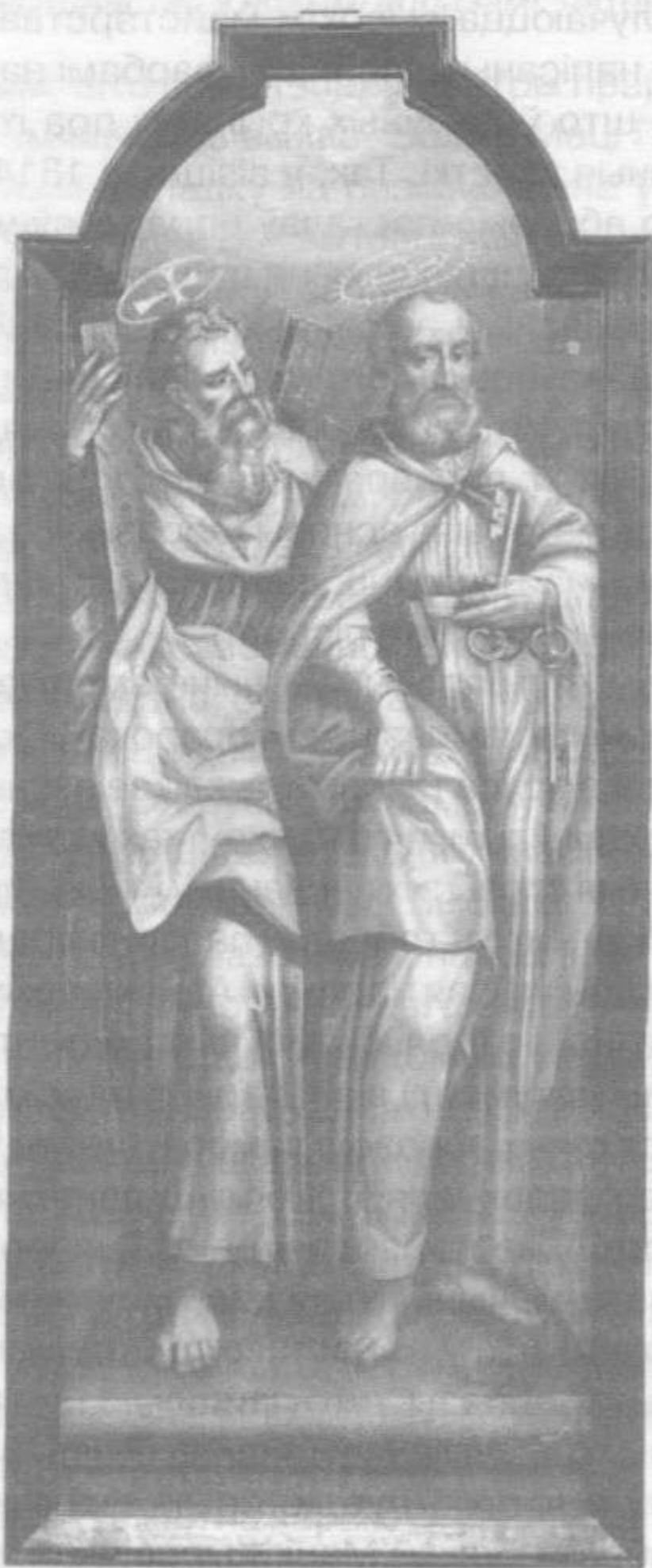
Апосталы Андрэй і Пётр.