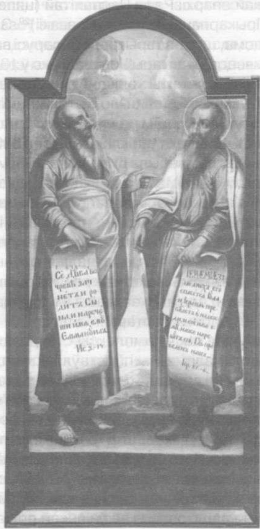
Прарокі Ісая і Іераміі.