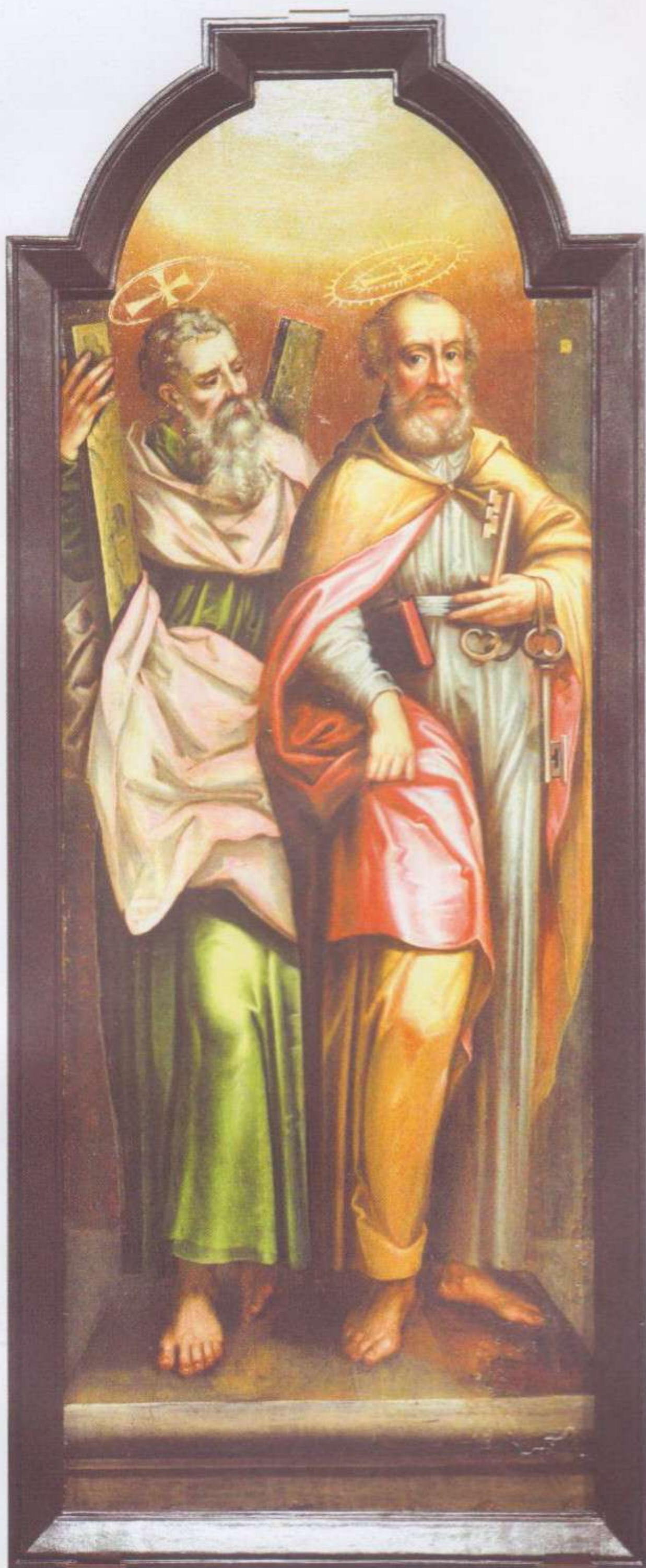
Апосталы Андрэй і Пётр.

Абразы іканастаса Успенскага сабора Жыровіцкага праваслаўнага мужчынскага манастыра.