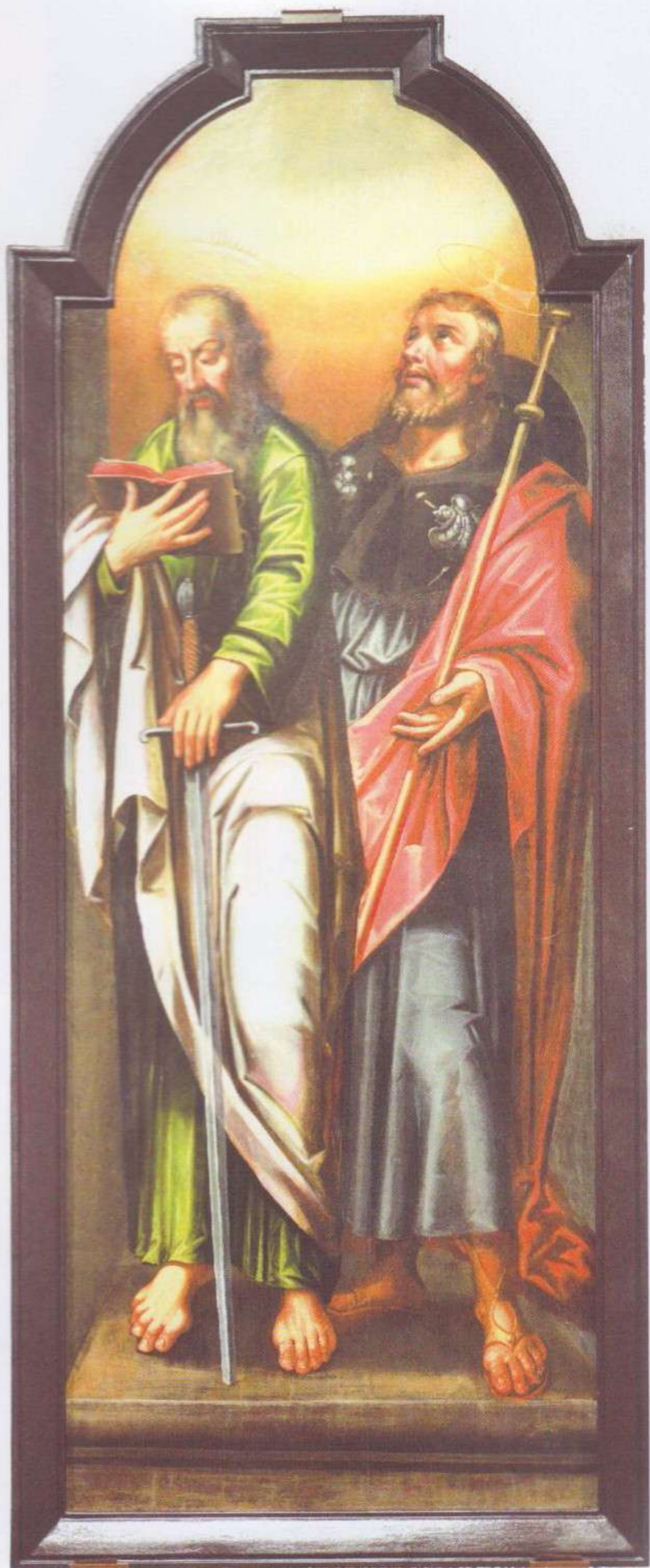
Апосталы Павел і Іакаў Зевядзееў.