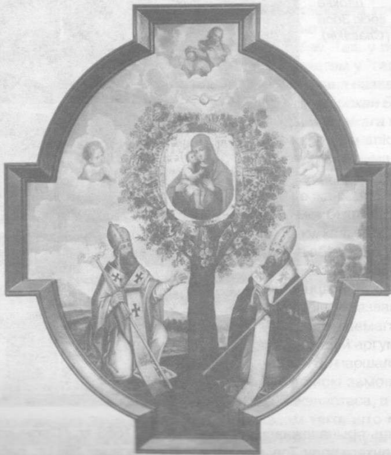
З'яўленне Жыровіцкага абраза Маці Божай.