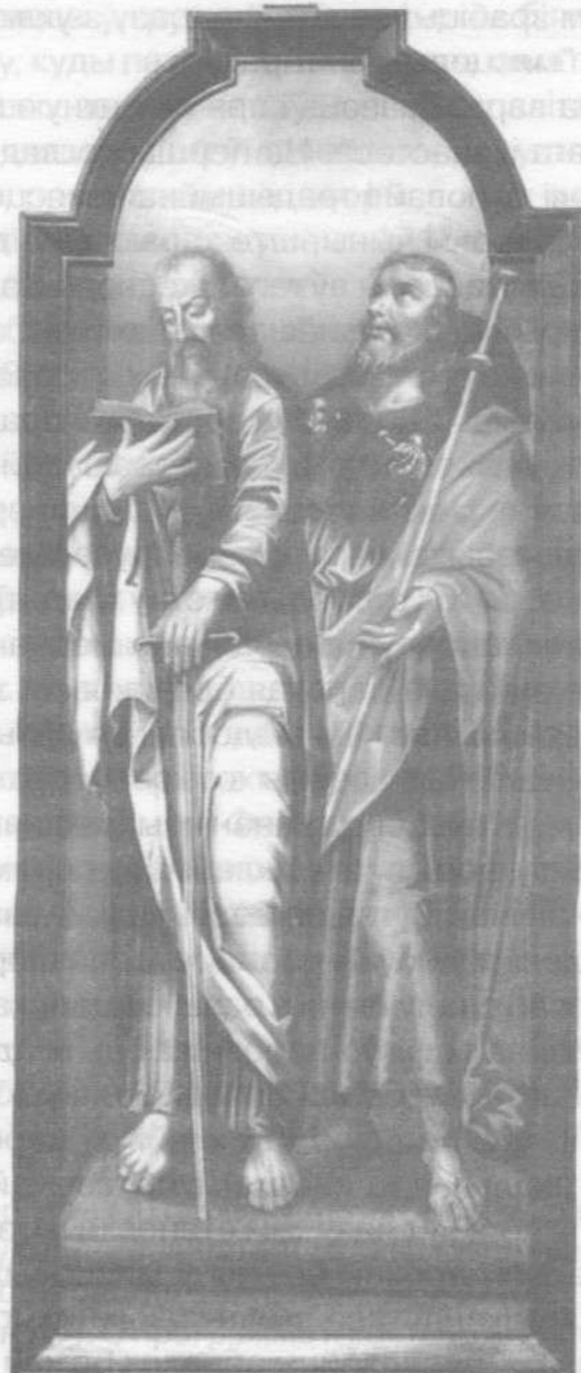
Апосталы Павел і Іакаў Зевядзееў.