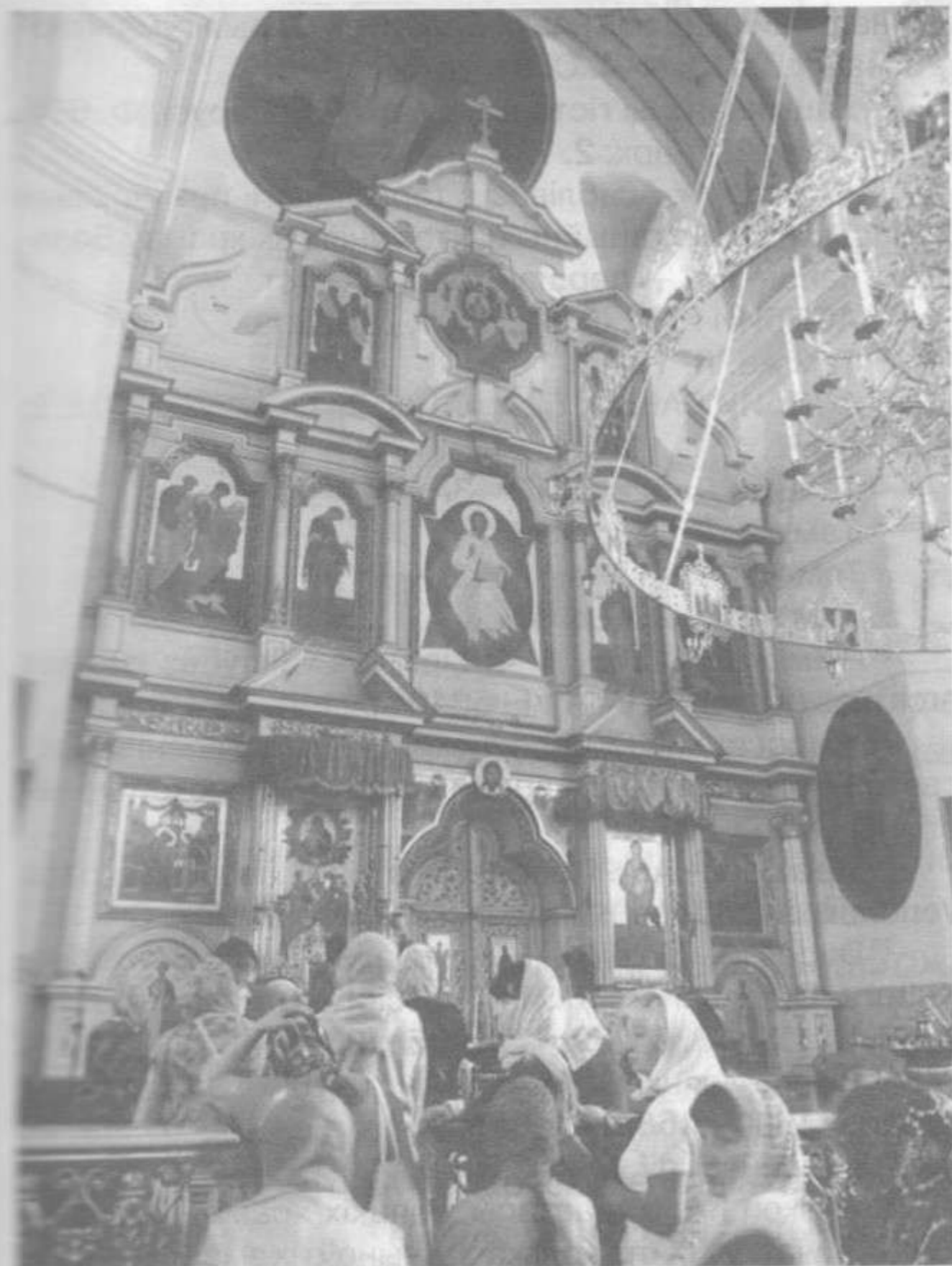
Жыровіцкі іканастас з новымі абразамі. Фота 2016 г.

Заўважым, што па канонах у цэнтры прарочага чыну павінна змяшчацца выява "Божая Маці Прадвесце". У дадзеным выпадку на размяшчэнне ў іканастасе абраза "З'яўленне Божай Маці Жыровіцкай" паўплывала тое, што Успенскі сабор быў вядомы сваёй святыннай, дзякуючы якой, паводле падання, тут і ўзнік манастыр.