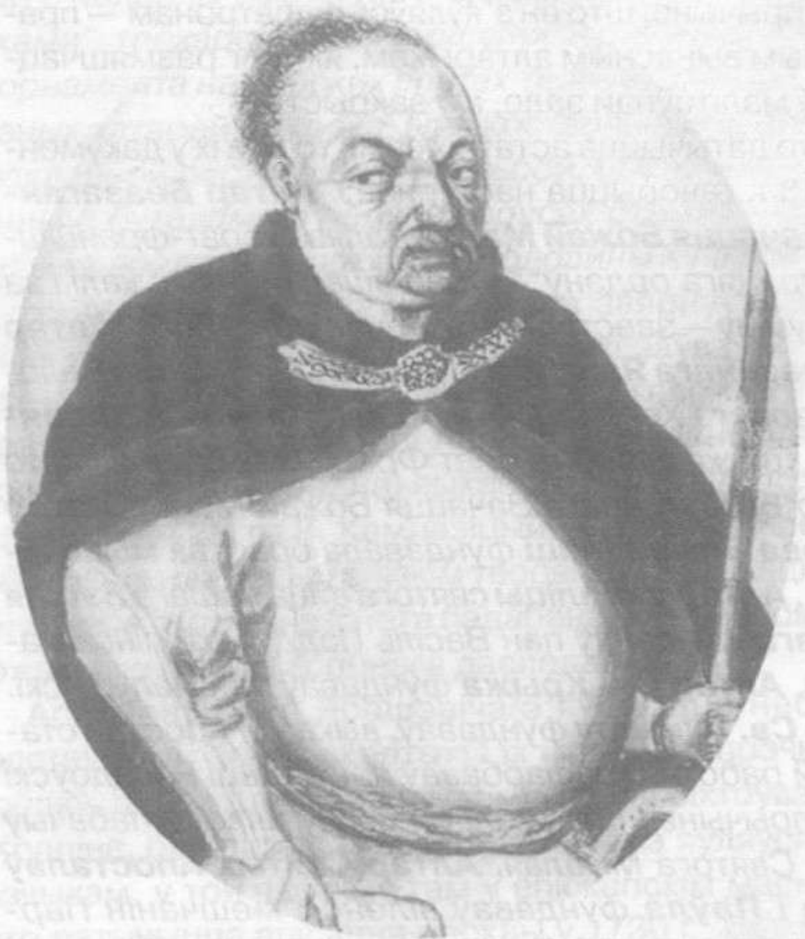
Аляксандр Гілярый Палубінскі, маршалак вялікі літоўскі.

алтар — па левым баку — Беззаганнага Зачацця Божай Маці... За галоўным алтаром альбо, як сказана, іканастанасам, знаходзіцца цыборый..." 23 . Апошні сказ надзвычай важны па той прычыне, што ў ім прасочваецца сінанімічнае выкарыстанне візітатарам двух разглядаемых паняццяў. Акрамя таго, з апісання іканастанаса становіцца зразумелым, што ён быў на той час новым. Хоць гэта прама нідзе не сказана, але ўзгадка пра тое, што ён "прыгожы", наводзіць на адпаведную думку. Адсюль можна заключыць, што гэты іканастанас быў пастаўлены незадоўга да візітацыі 1704 г., а значыць, не было неабходнасці яго мяняць у 1730-я гг.