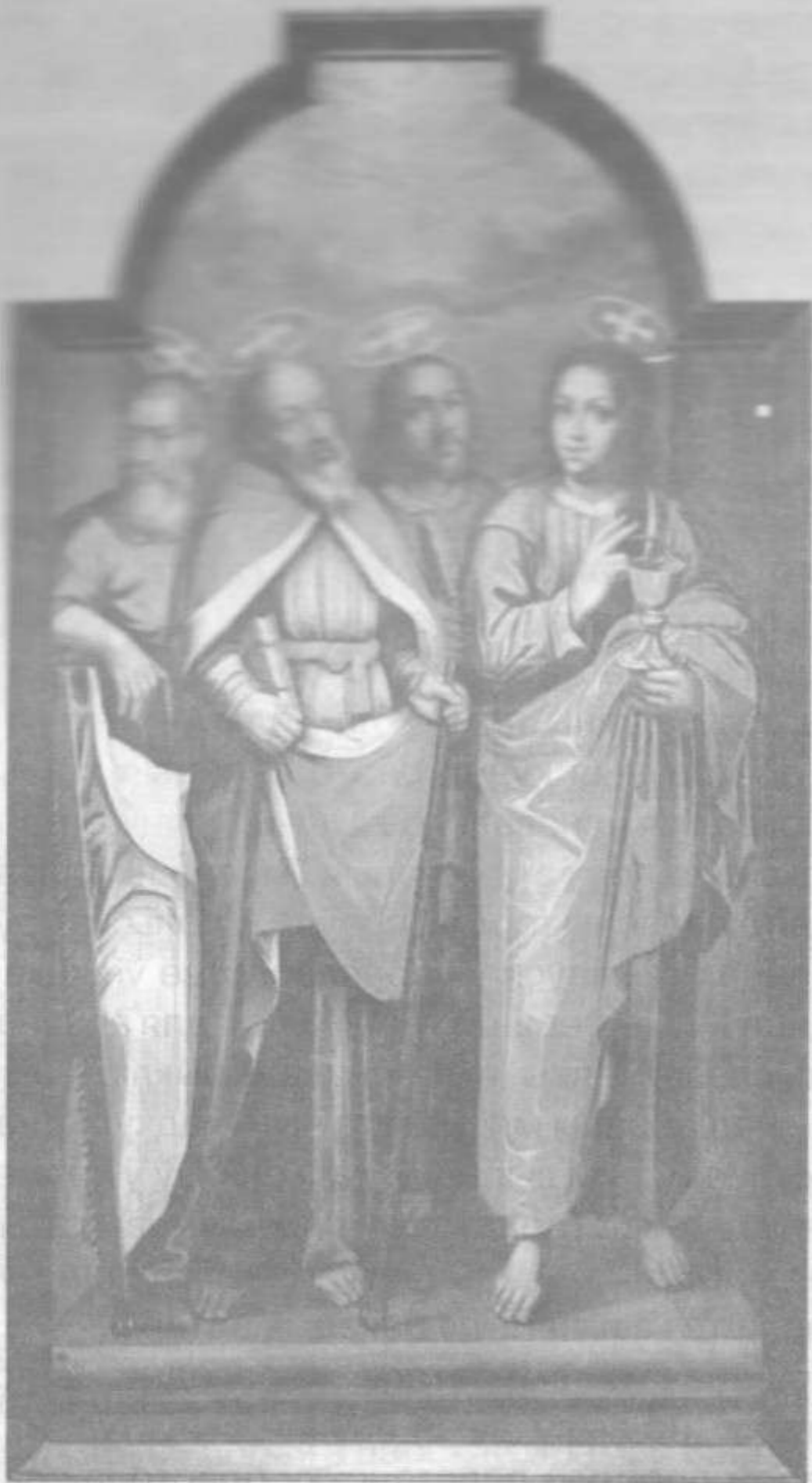
Апосталы Іаан, Іакаў Алфееў, Барталамей, Сіман Канаіт.