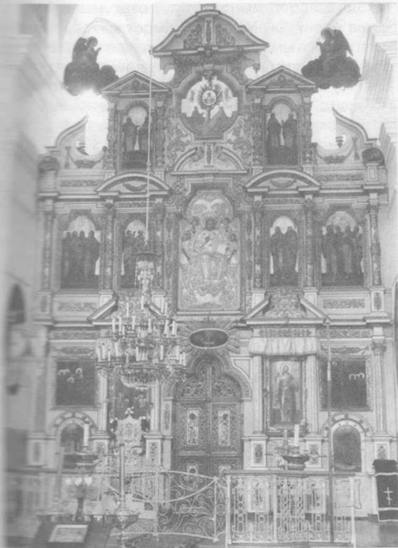
Жыровіцкі іканастас з аўтэнтчнымі абразамі. Фота да 2009 г.

іканастасамі храмаў Магілёва і Віцебска, вядомымі па старых фотаздымках, ён выглядае больш сціплым і не стварае на першы погляд уражання ўнікальнага мастацкага твора. А ў параўнанні з творамі найўнага мастацтва, якія захаваліся ў храмах Палесся, разглядаемы помнік можа выглядаць "не самым яскравым прыкладам" беларускіх іканастасаў.