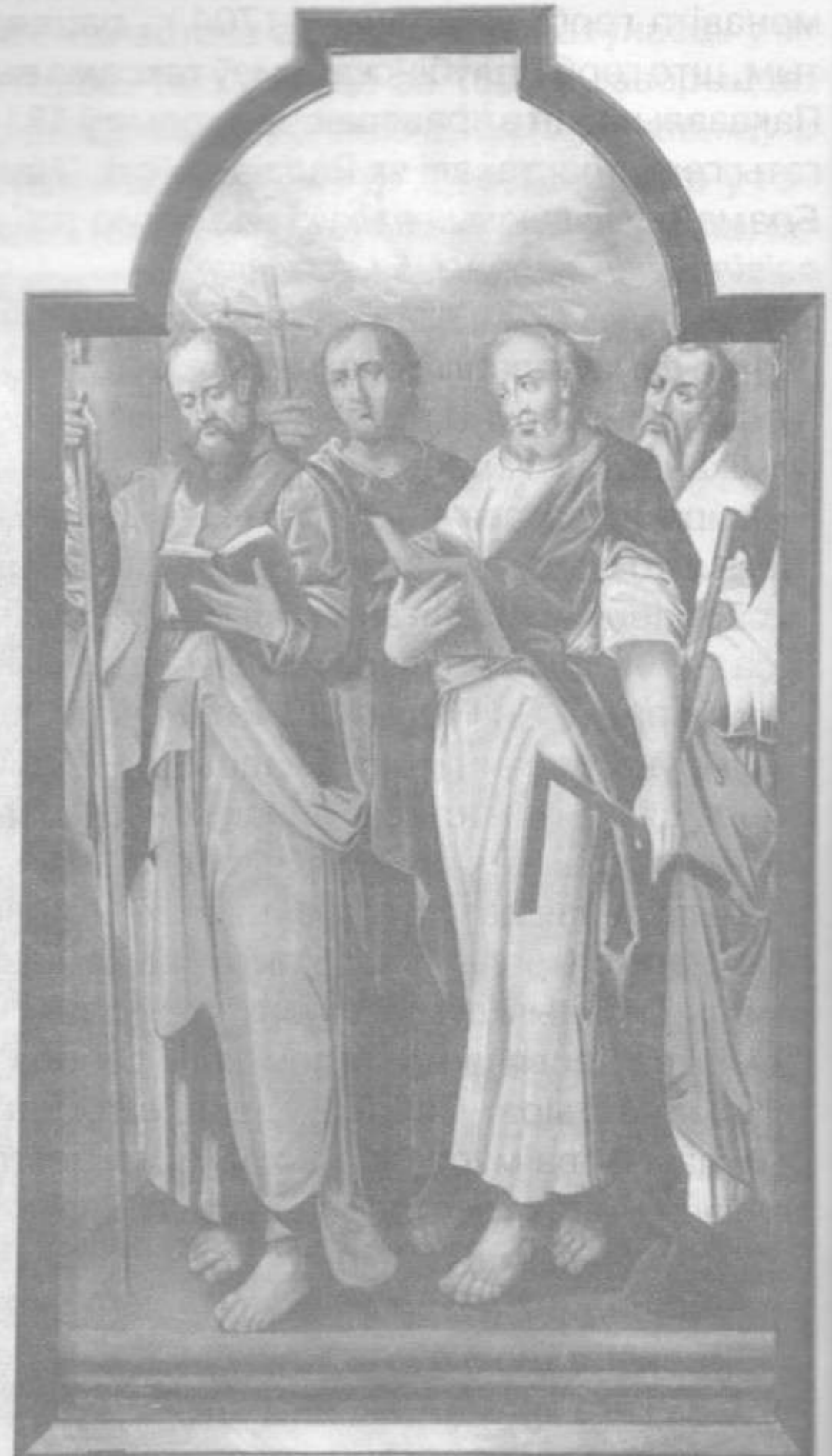
Апосталы Іуда (Фадзей), Філіп, Фама і Матфей.