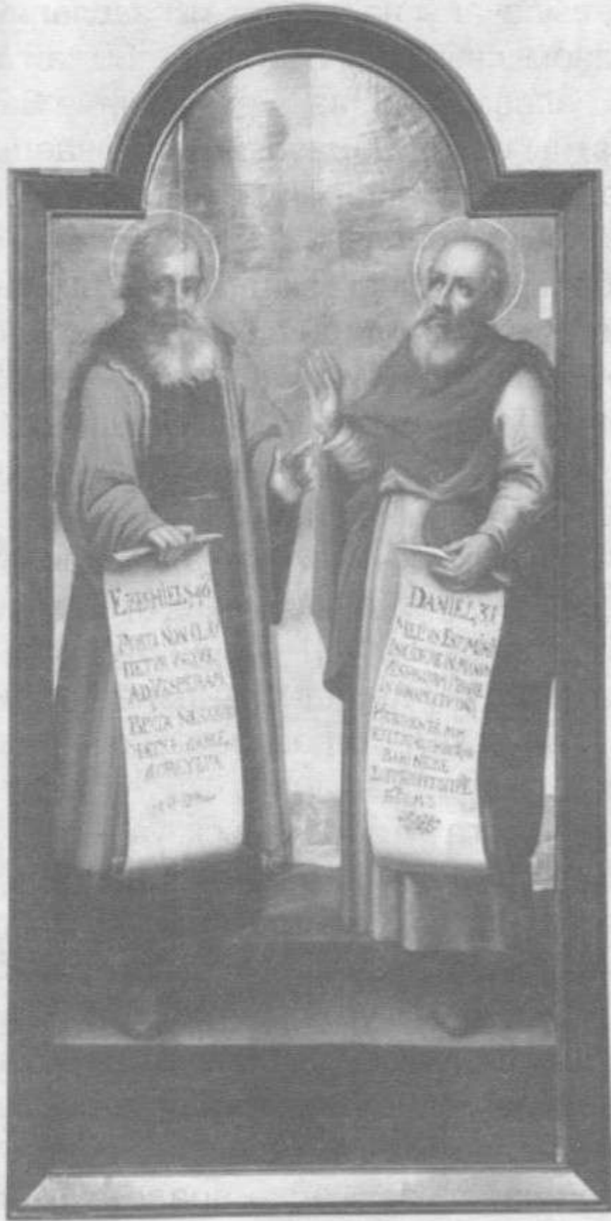
Прарокі Эзэкіль і Данііл.