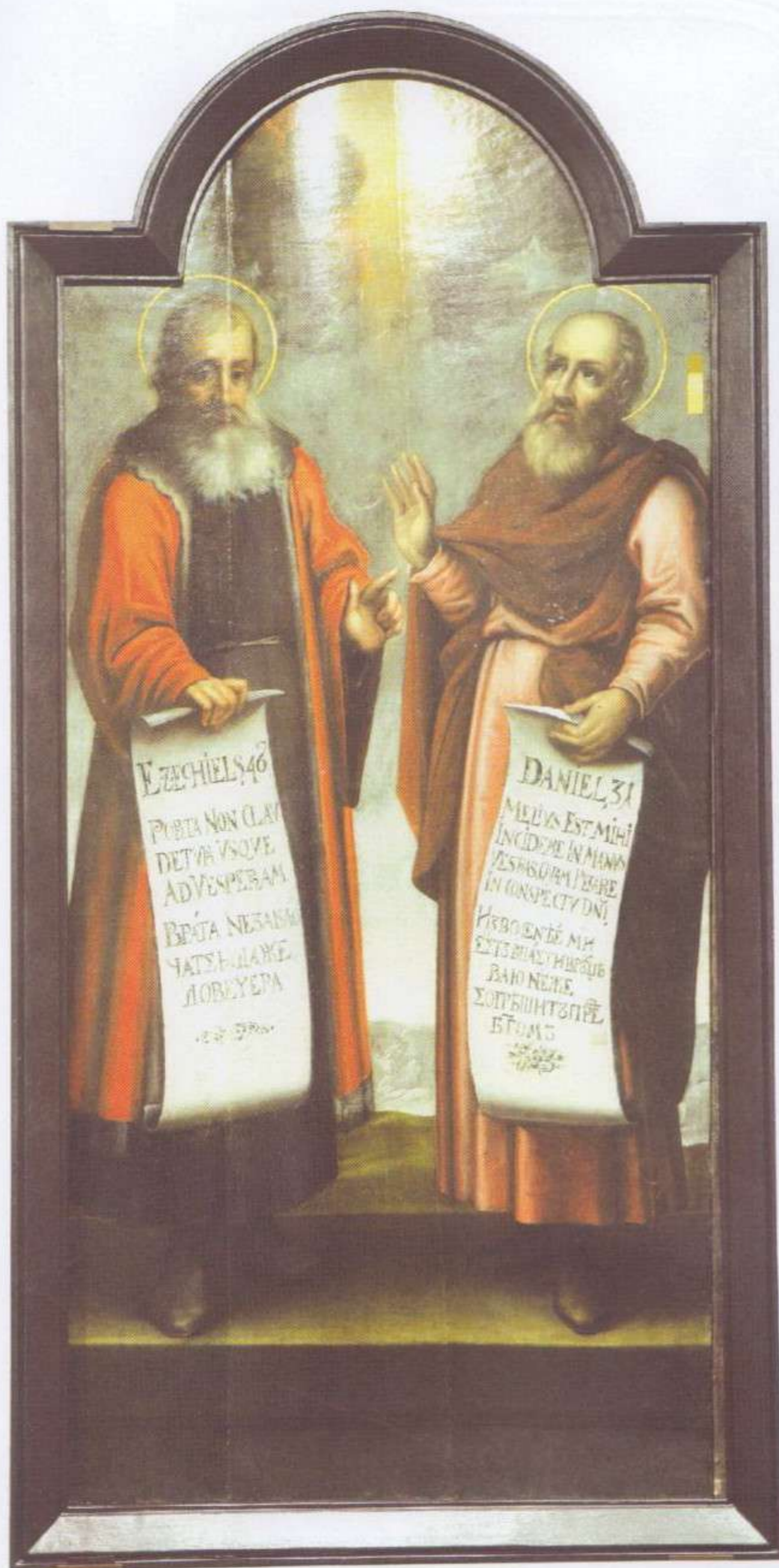
Прарокі Эзэкіль і Данііл.

Абразы іканастаса Успенскага сабора Жыровіцкага праваслаўнага мужчынскага манастыра.