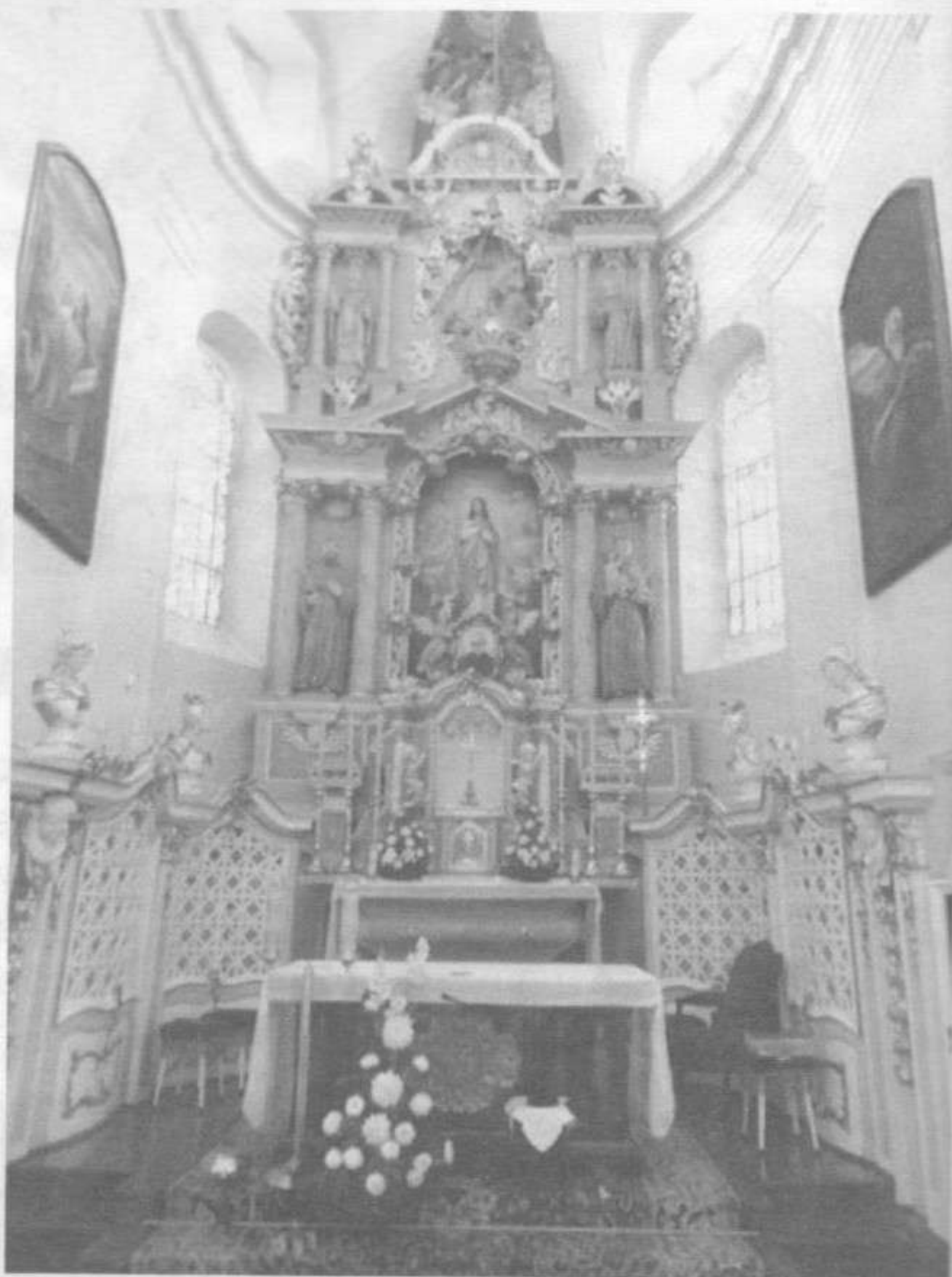
Галоўны алтар касцёла Божай Маці Анёльскай у Гродна.