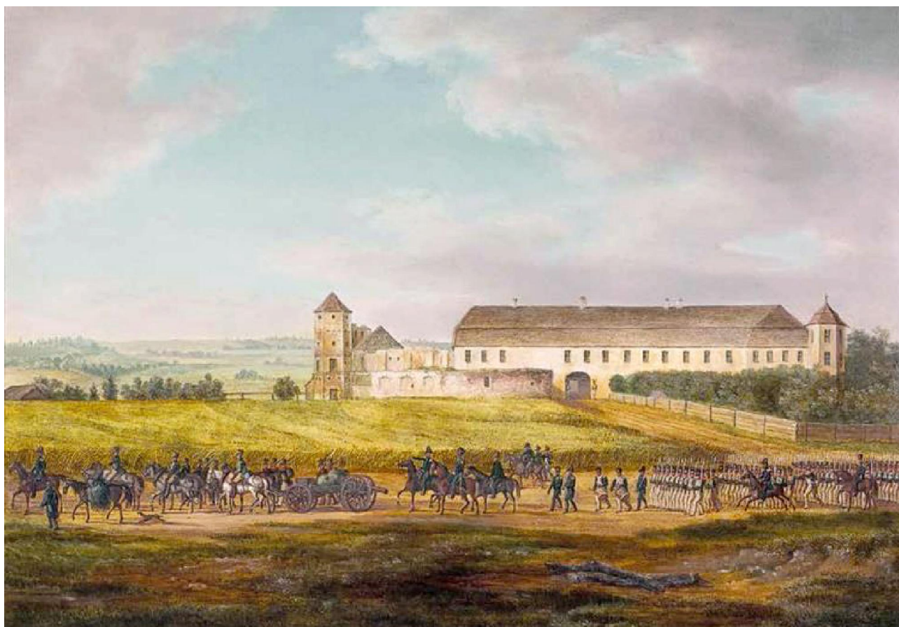
Гальшанскі замак, 1812 г.

Да рэшткі ацалелых муроў вядуць два выйскі. Адно з унутранага дзядзінца ў вялікія прадсені і незвычайна шырокія сходы з невялікім ухілам. Некалі, праўда-падобна, гэта быў галоўны, парадны ўваход. Другі, больш сціплы, знаходзіцца ля ўязной брамы. Ён вядзе ў шэраг высокіх і прасторных пакояў, якія анфіладай ідуць уздоўж усяго фасаднага боку замка. Першыя сходы вядуць на другі бок і сёння жылога замка. Пакой гэтай часткі таксама вельмі прасторныя, з вялікімі вокнамі заглыбленымі ў