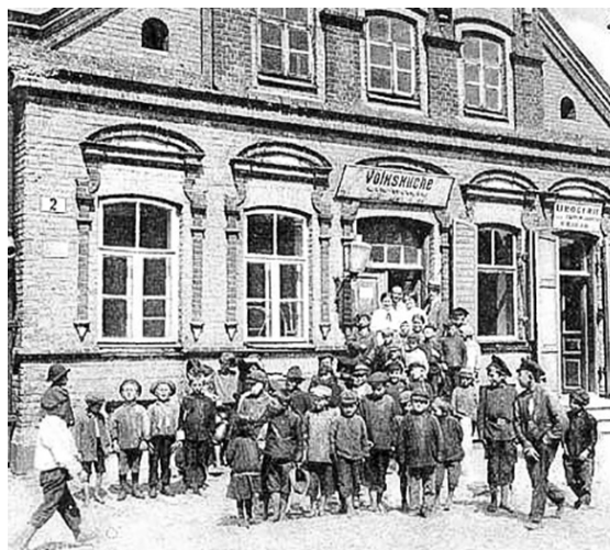
Яўрэйская бясплатная кухня для бедных.

«Ліда — гэта адзін з найбольш старых гарадоў Краю. Ад пачатку горад і ваколіцы былі незалежным удзельным княствам князёў Дайноўскіх. У 1180 годзе заваёваны літвінамі, якія зруйнавалі горад і адбудаваці новую Ліду. Ліда была памежным горадам паміж Літвой і Русю. У 1242 гаду да Ліды дайшлі манголы, але былі разбіты. У 1326 г. вялікі князь Гедымін пабудаваў мураваны замак. Ягайла дараваў горад свайму улюбёнцу Вайдылу. У 1381 года горад заваяваў князь Вітаўт з дапамогай немца Конрада Валенрода, узяў і зруйнаваў горад. У 1394 г. горад ізноў быў зруйнаваны крыжачкамі. У часе войнаў паміж маскалямі і Рэччу Папалітай Ліда не раз цяжка пацярпела. Гэтак яе зусім зруйнаваў у 1659 г. князь Хаванскі. У 1702 г. шведы ўзарвалі лідскі замак. Гарадскі архіў перавезлі ў Смаленск, дзе ў 1812 г. ён згарэў. У 1795 г. горад далучаны да Расеі. Ад 1802 г. горад належаў да Гродненскай губерні. У 1842 г. Ліду зрабілі павятовым горадам і далучылі да Віленшчыны. Герб Ліды, засведчаны ў 1845 г., складаецца з двух частак: у верхняй частцы — герб Віленскай губерні, у ніжняй — на зялёным полі сноп і серп, як знак,