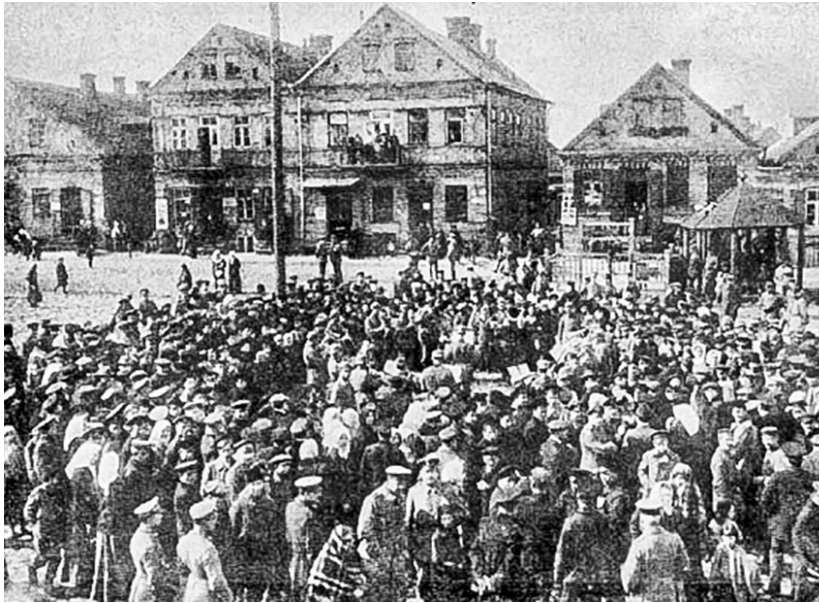
Рынкавая плошча.

Сыходзячы з горада, згодна з Берасцейскай дамовай, нямецкія войскі перадалі зброю мясцоваму Рэвалюцыйнаму камітэту. У ноч з 27 на 28 снежня 1918 года часткі германскіх войскаў пачалі пакідаць Ліду, і 3 студзеня 1920 года нямецкія войскі пакінулі тэрыторыю Лідскага павета. За тры дні праз чыгуначную станцыю прайшло больш за тры дзясяткі цягнікоў са зброяй, амуніцыяй, фуражам і іншым вайсковым абсталяваннем. Трэба адзначыць, што на-