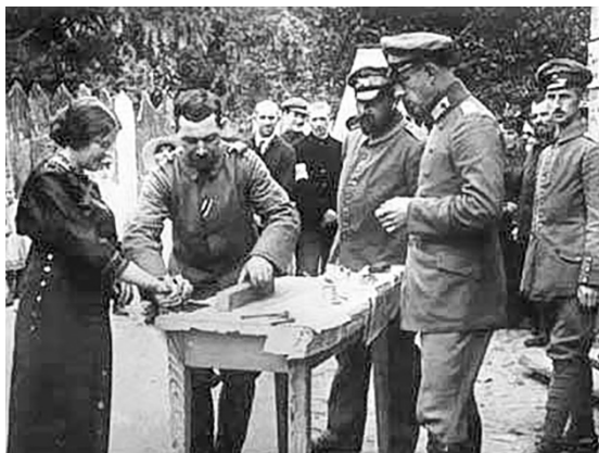
Бяруць адбіткі пальцаў.

Канешне ж, не заўжды рабаўніцтва заканчвалася забойствам. У верасні «Гоман» расказаў такую крымінальную гісторыю: «У двух яўрэй з Ліды з пасвішча ўцяклі дзве каровы. Іх знайшлі ў Радунскім павеце. Па дарозе да хаты каля Кербядзёў іх затрымалі два невядомыя і запатрабавалі грошы. Міравы суд абодвух ліхадзёў за гвалт засудзіў на 6 месяцаў у астрог кожнага» 11 .