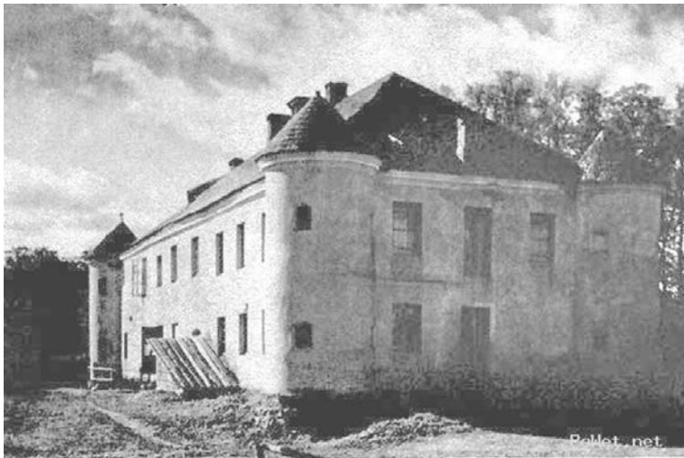
Дом-крэпасць у Гайціюнішках быў узведзены з цэглы на левым беразе ракі Жыжма па праекце гаспадара дома ў 1611—1612 гадах.

Кожны з іх на сваім фальварку працаваў з замілаваннем і нават з запалам, устаючы з рання да ўдою, а ўдзень пільнуючы працу ў полі. Былі яны занадта незалежнымі і падобнымі да герояў апавесці... Хадзілі ў доўгіх ботах і кажухах, пасмы валасоў спадалі ім на лоб, пагарджалі раскошай і жылі па-спартанску. Яны разам складалі салідарны сямейны клан, але фанабэрытасць шляхты ў іх дапаўнялася дэмакратычным пазітывізмам».