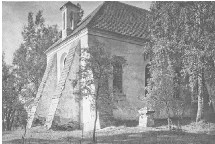
У 1808 годзе Караль Остэн-Сакен зрабіў на сцяне капліцы вялікую эпітафію пра гісторыю яго сям'і XVIII і пачатку XIX стагоддзя.