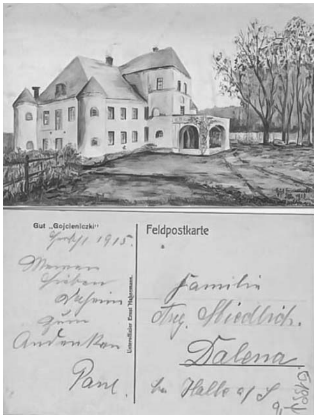
Гайцюнішкі ў 1915 годзе. Паштоўка.

Цікавыя факты і дадумкі можна прыводзіць і далей, але, верагодна, замак Гарэшкаў у Міцкевіча — сінтэтычны вобраз замкаў яго радзімы. Памяць пра Гайцюнішкі дом-крэпасць і Мірскі замак адбілася ў запамінальны літаратурны вобраз.