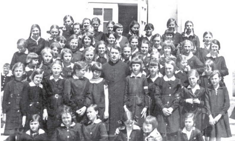
Вучаніцы школы імя Нарутовіча каля будынка школы, 1936 год