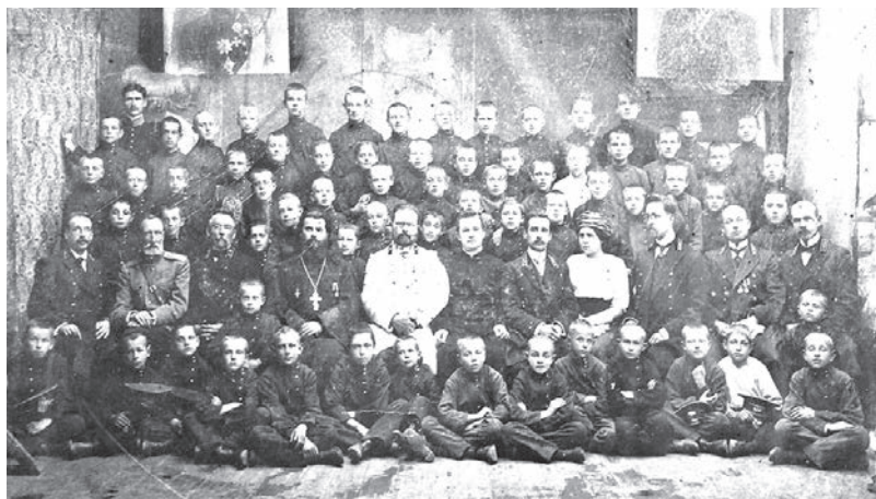
Першы клас Лідскай мужчынскай гімназіі, 1914 год