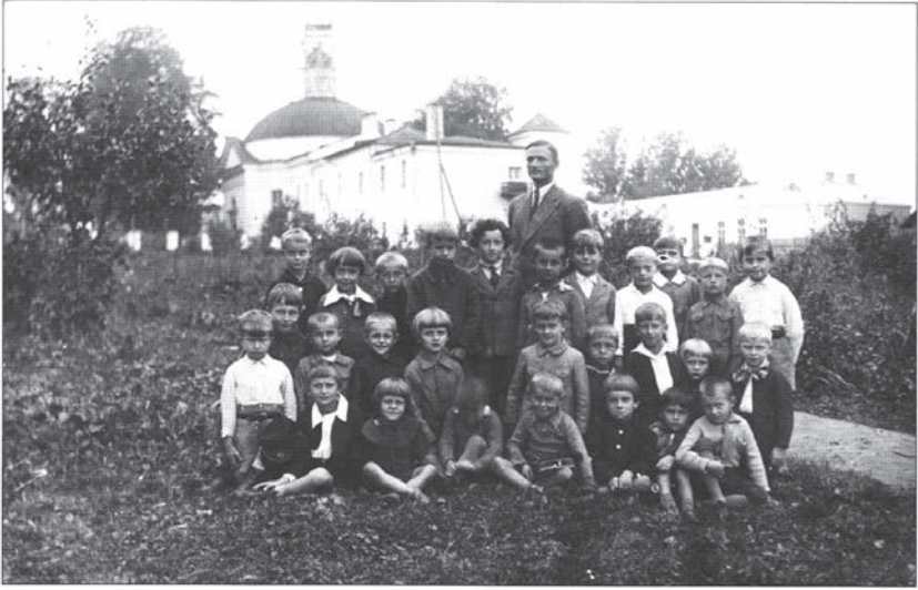
Група вучняў за школай піяраў, 1930-я гады