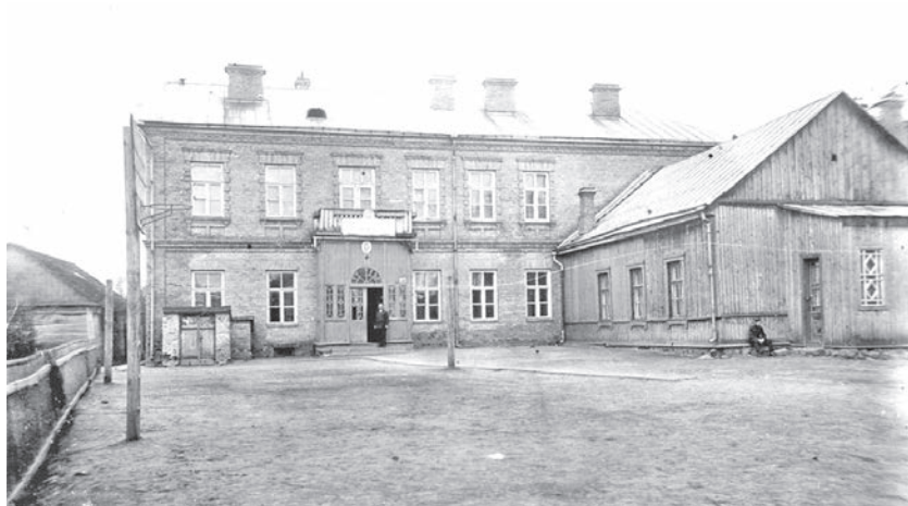
Будынак дзяржаўнай гімназіі, 1920-я гады