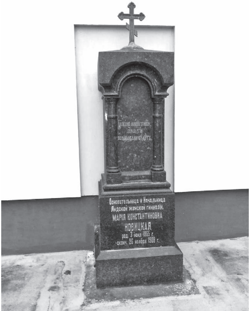
Помнік на магіле М. К. Навіцкай каля Свята-Георгіеўскай царквы ў Лідзе