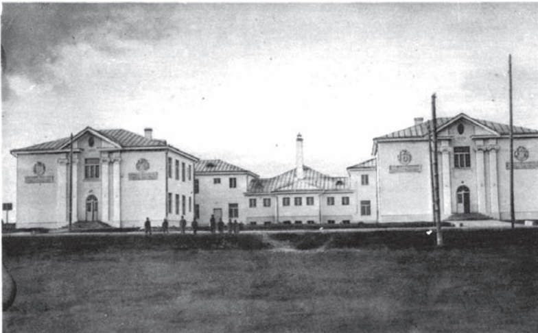
ЛІДА. Szkoła Powszechna im. Narutowicza.