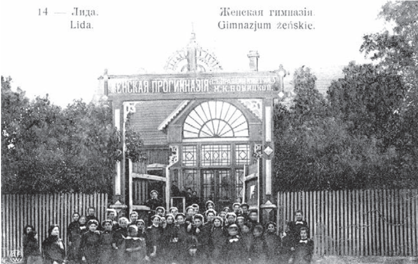
Жаночая прагімназія М. К. Навіцкай (да 1908 года)