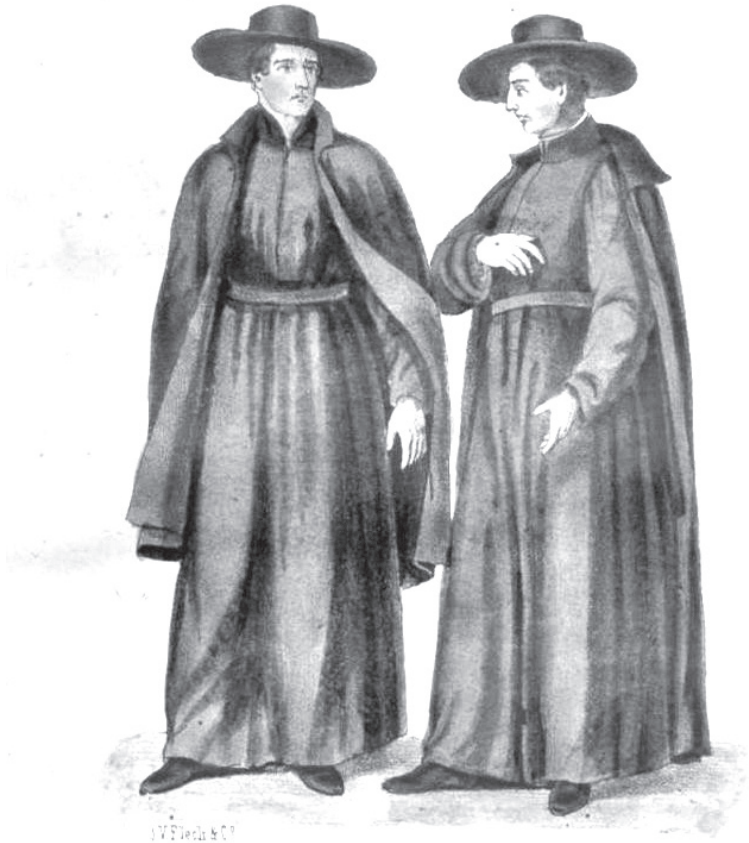
Манахі-піяры ў XVIII ст.

дарэчы, прыводзіў лідскую школу як узор. Сучаснікі лічылі гэтыя словы найвялікшай хвалай і вянцом дзейнасці школы.