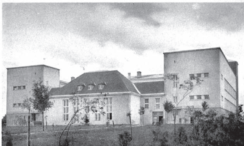
ЦДА. Gimnazjum Państwowe