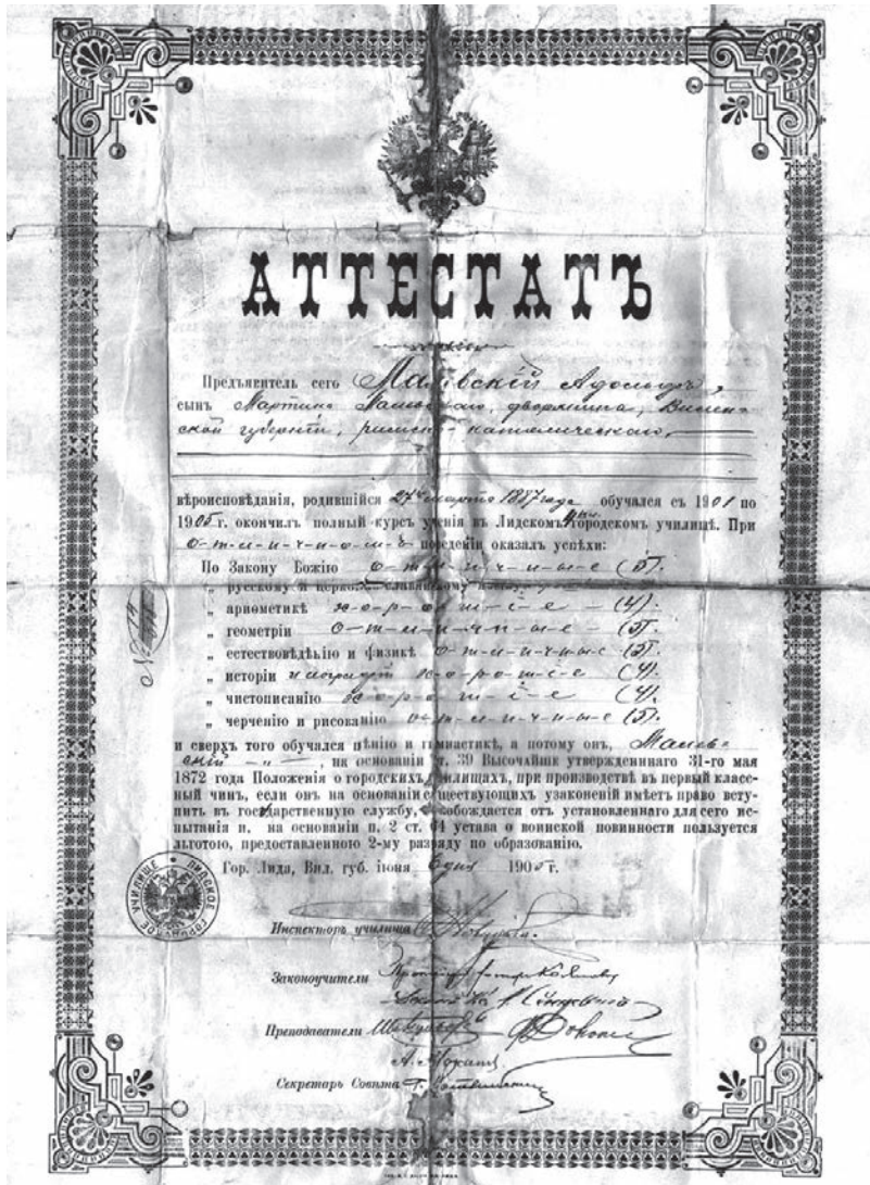
Атэстат Адольфа Малеўскага аб заканчэнні Лідскай чатырохкласнай гарадской вучэльні ў 1905 годзе. Вывучаліся: Закон Божы, руская і царкоўнаславянская мовы, арыфметыка, геаметрыя, прыродазнаўства і фізіка, гісторыя і геаграфія, чыстапісанне, чарчэнне і маляванне. У атэстаце адзначана, што Малеўскі можа атрымаць першы клас чыноўніка без іспытаў і карыстаецца льготамі на падставе закона аб воінскай павіннасці