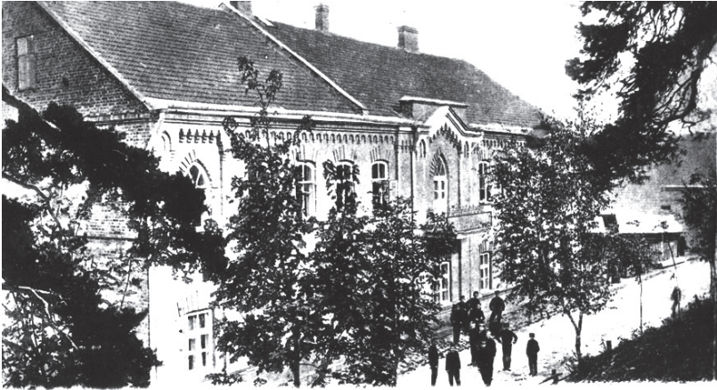
Ліда. Городевое Училище.