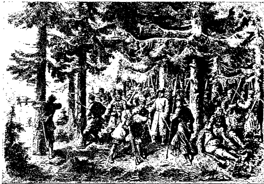
Перестрѣлка польскихъ повстанцевъ съ русскими войсками на опушкѣ лѣса.