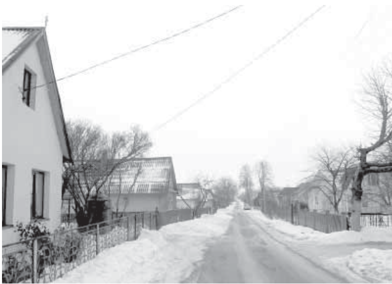
Вуліца Сымона Буднага за пасёлкам Дамкі - былая вёска Агароднікі. Сёння гэта досыць разбудаваная частка горада.

шыбе, досыць высокая, іх было бачна і з Рагушняй плошчы, і з-пад кляштарных сценаў насупраць, і з самога Радзівілаўскага палаца. Тут жа на пагорку, за Дамкамі жыла сваім ціхім жыццём вёсачка Агароднікі, цяпер адна з многіх вуліц Новага Места на ўскрайку горада.