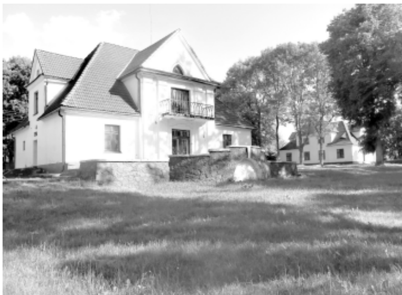
Цэнтральны дамок з тэрасай (пярэдні план). Аўтарская хроніка, сакавік 2017 г.

З погляду турыстыкі, якая быццам прاپісалася ў Нясвіжы, гэты раён, улучна з Брамай - ці не поўная процілегласць Замкаваму комплексу. Дзесяцігодзі акупаваны медычнымі службамі, "былы пасёлак лясніцтва" з будынкамі закапанскай архітэктурцы пакуль аніяк не даступны турыстам. Пра гісторыю і ягоную цікавостку няшмат распавядуць і жыхары Нясвіжа. Ці не таму вока забудоўнікаў і рушыла сюды, на гэты ціхі востраў, дый інвестар, пэўна, доўга не вагаўся.