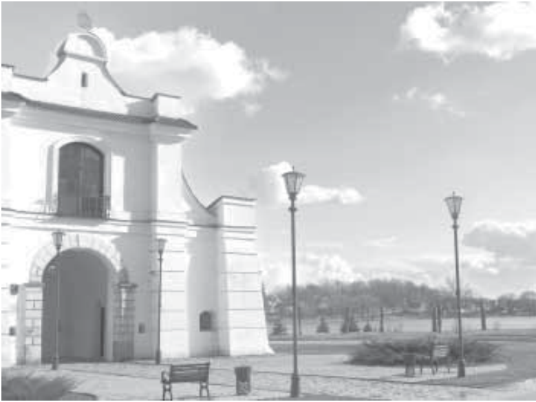
Слуцкая брама. Справа пагорак з дамкамі.

ўправа на Клецак, леваруч - на Капыль і Узду, а дарога наўпрост пакіруе на Слуцк. За возерам (правая частка здымка) - узгорак з гістарычнай забудовай Дамкі.