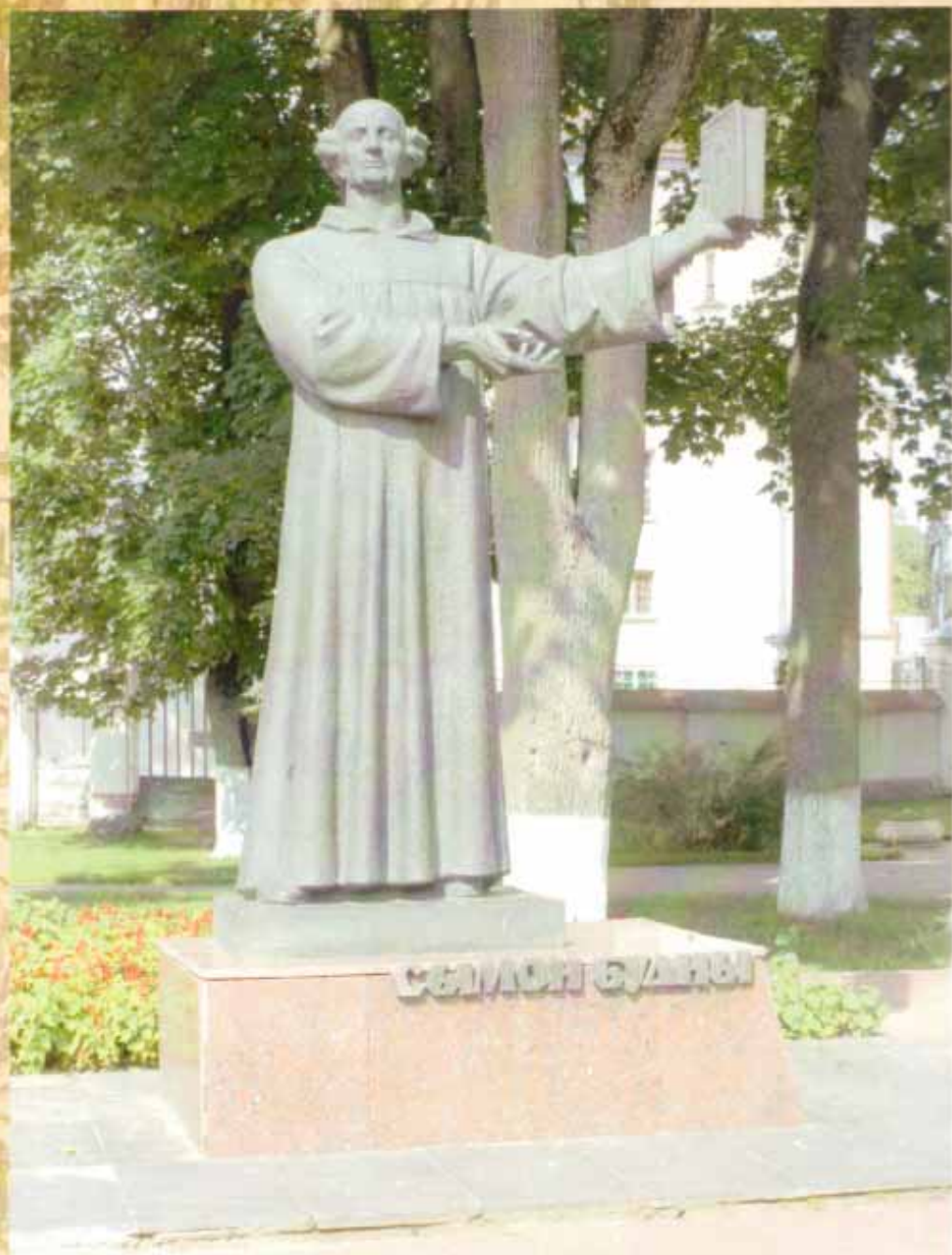
Помнік Сымону Буднаму ў Нясвіжы. 2017 г.