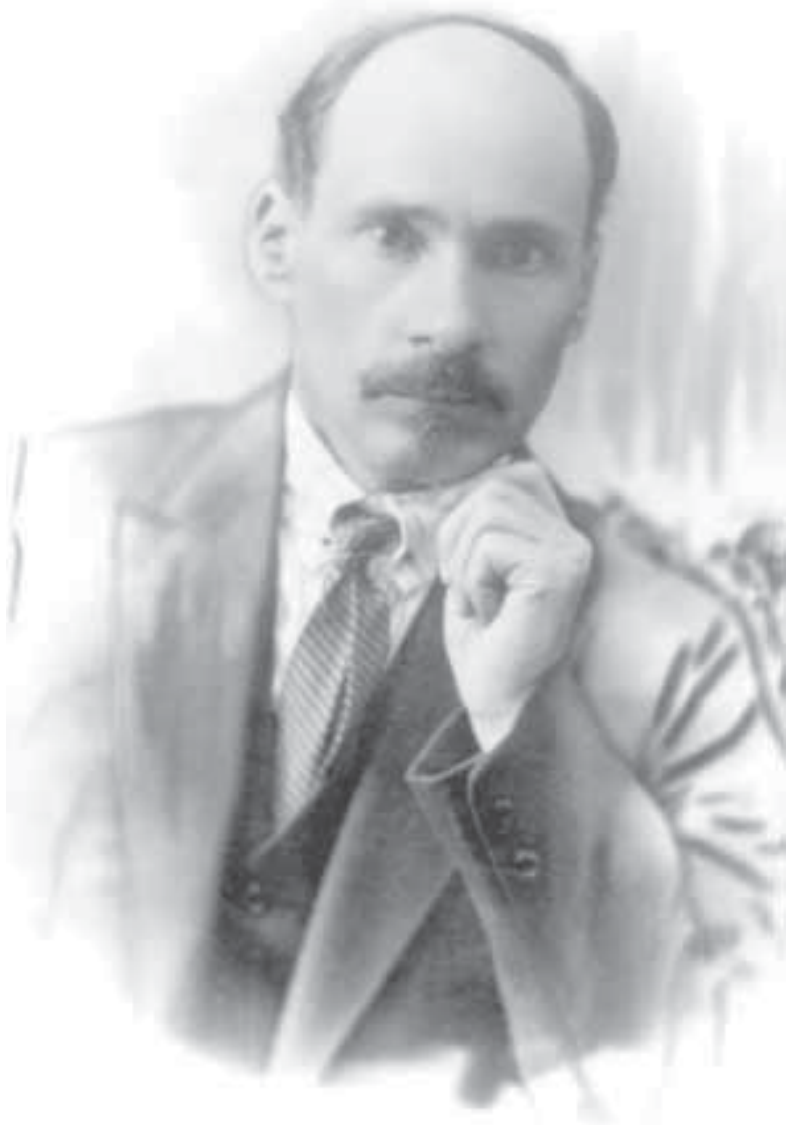
Якуб Колас (3.11.1882 - 13.08.1956) Выпускік Нясвіжскай настаўніцкай семінарыі 1902 г.