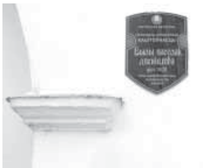
Ахоўная шыльда на цэнтральным дамку. Аўтарская хроніка, сакавік 2017.

Доктар архітэктуры, педагог і даўні сябар міністэрскай рады Армэн Сардараў лёгка прыпамінае тое абмеркаванне: так, "былі ў Нясвіжы, глядзелі на месцы..."