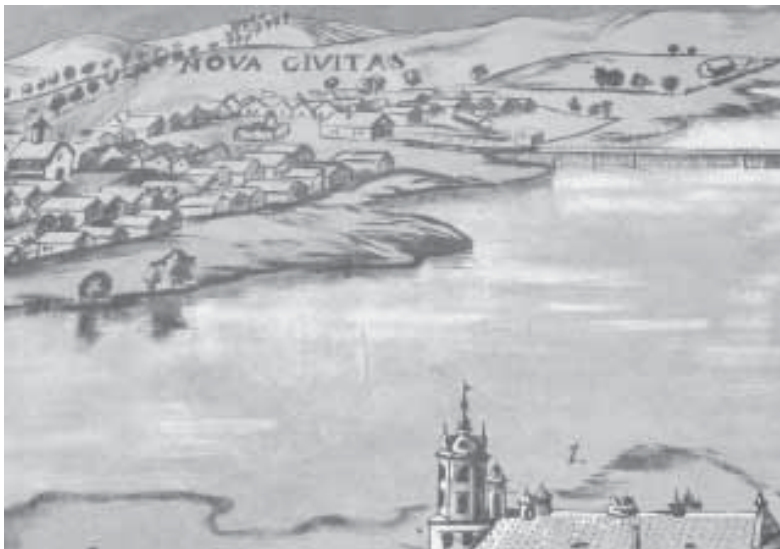
"Nova Civitas". Фрагмент перамаляванай гравюры Тамаша Макоўскага, што сёння размешчаны на сцяне будынка побач Ратушнай плошчы. Студзень 2017 г.

Што магло здарыцца на старажытных пагорках Новага Места ў Нясвіжы? Адкуль надышоў гэты да аглушэння падступны гвалт? Я адчуў яго не адразу і не воюема, хоць за мной штохвілінна сачыла "вока" той, зламыснай пачвары.