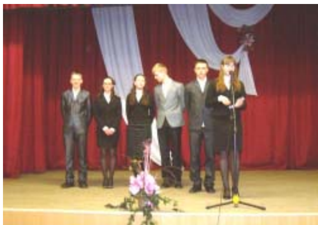
Пераможцы конкурсу - каманда Бердаўкі