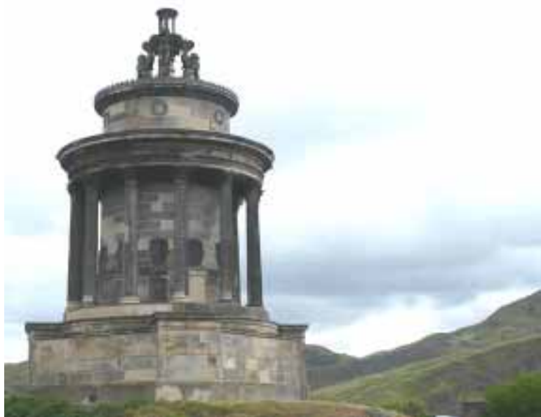
Мемарыял Роберта Бернса ў Эдынбургу