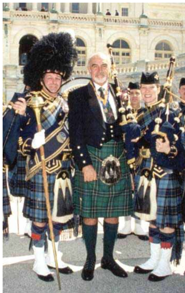
Шатландскі актёр, сэр Шон Конэры сярод шатландскіх музыкаў. Сэр Конэры нарадзіўся ў Эдынбургу, з’яўляецца сябрам Шатландскай нацыянальнай партыі.