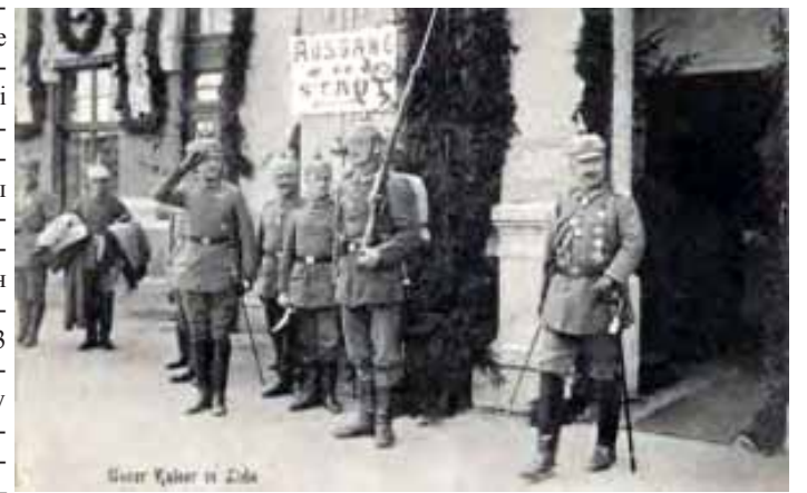
Нямецкі кайзер Вільгельм на Лідскім вакзале ў 1915 г.

Пасля пачатку Першай Сусветнай вайны і паразы рускіх войскаў ва Ўсходняй Прусіі пачалося наступленне немцаў ва Ўсходняй Польшчы. Рэзка вырасла значэнне Лідскага аэрадрома, сюды з-пад Варшавы пераляцела эскадра самалётаў «Ілья Мурамец». Узнікла патрэба ў дастаўцы вялікай колькасці грузаў на аэрадром і была пабудавана каля ад вакзала да аэрадрома. Легендарнай асаблівасцю гэтай будоўлі стала тое што будавалі каляю, у тым ліку цераз пойму рэчкі Лідзэйкі, адны жанчыны (мужчыны пагалоўна былі мабілізаваны ў войска). Аднак немцы акупавалі Заходнюю Беларусь. Пры адступленні