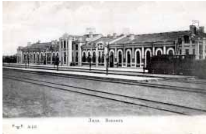
Новы вакзал у Лідзе, пабудаваны ў 1906 г.

Пасля аднаўлення вакзал быў пафарбаваны ў светла-крэмавы колер і пакрыты чырвонай дахоўкай. Пасярэдзіне была зала білетных касаў і памяшканне для захоўвання багажу. Дзіцяці прыцягвалі 2 аўтаматы, якія прадавалі смачны шакалад: малая плітка каштавала 20 а вялікая 50 грошаў. Злева ад цэнтральнай залы была вялікая зала чыгуначнага рэстарана 1-га класу з буфетам: «У рэстаране можна было смачна пад'есці, а ў буфэце атрымаць розныя