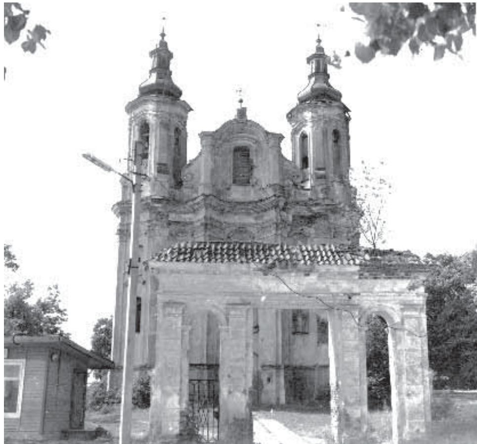
Слонімска касцёл Святога Андрэя ў 80-я гады 20-га стагоддзя

Атмасфернаму разбурэнню найбольш падвергся фасад: пачалі адвальвацца карнізы, выпадаюць са сцен цагляныя. Пашкодзана правая вежа, з яе купала адрываецца бляха. Ва ўсіх вокнах выбіта шкло. Вакol некаторых аконных праёмаў таксама адвальваюцца цагляныя. Значна пацярпелі ад разбурэння прыбудовы пры бакавых сценах. На левай прыбудовы няма страхі, абсыпалася