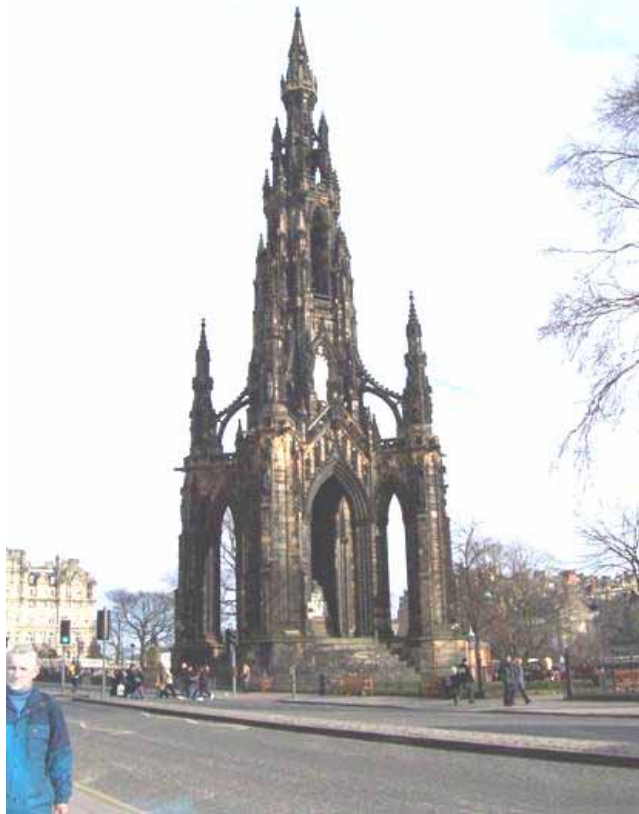
Помнік сэр Вальтару Скоту ў Эдынбургу

Адукаваныя шатландцы пераходзілі на англійскую мову, якая таксама пачала моцна ўплываць на скотс. Даходзіла да анекдатычных выпадкаў. Так, шатландскі паэт і філосаф Джэймс Біцці выдаў слоўнік скотыцызмаў не для адраджэння мовы скотс, а спецыяльна для таго, каб паказаць суайчыннікам, якіх словаў яны павінны пазбягаць у правільнай англійскай гаворцы. Было створана таварыства па расоўванні англійскай мовы ў Шатландыі. Быць шатландцам