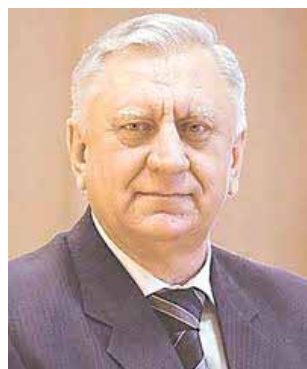
Матэрыял падрыхтаваны на аснове публікацыі Алены Васільевай у "Белгазеце" ад 3 верасня, с. 19.

Ад сябе дадамо, што было б добра, каб прэм'ер-міністр падтрымаў міністра адукацыі з яго ініцыятывай аб пераходзе ва ўсіх школах Беларусі незалежна ад мовы навучання на выкладанне гісторыі і геаграфіі Беларусі па-беларуску. Тады б і колькасць гадзін на маўленне на дзяржаўнай беларускай мове ў школе вырасла б.