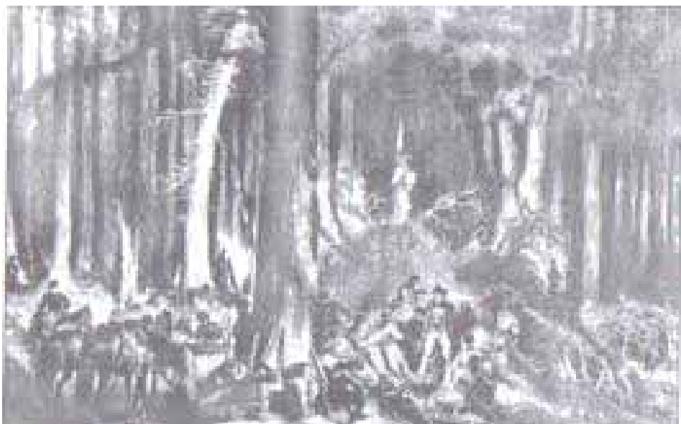
М.Э. Андрыёлі. Лагер паўстанцаў Л. Нарбута.

Астрога правёў некалькі баёў у чэрвені, з якіх найбуйнейшым і найлепш пра-