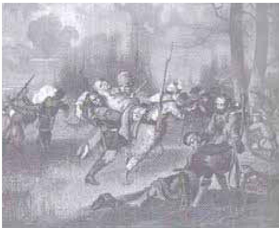
М.Э. Андрыёлі. Смерць Людвіка Нарбута каля Дубічаў.

смяртэльна паранены ў другой бітве пад Дубічамі 5 траўня 1863 года.