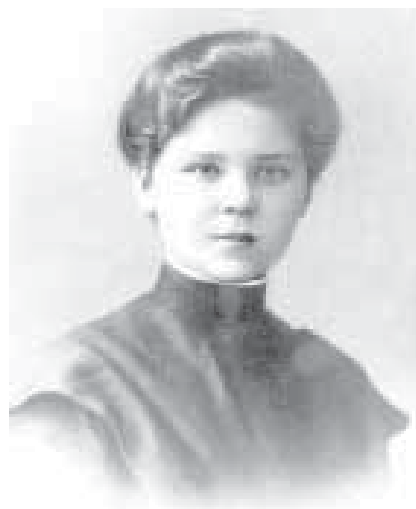
Марыя Міцкевіч з Каменскіх, жонка Якуба Коласа