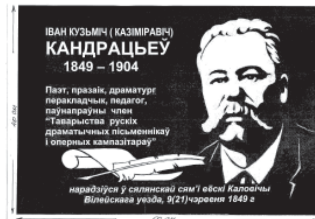
Эскізі мемарыяльнай дошкі Івану Кандрацьёву