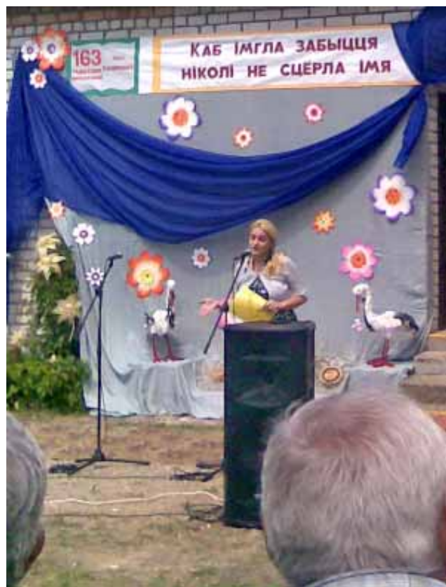
Святла ў Вілейцы