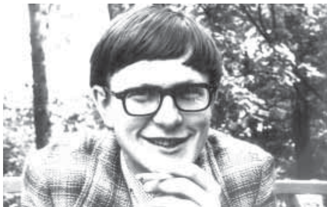
У школьныя гады