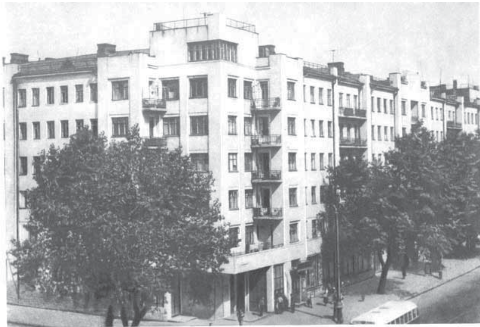
З'яўляюцца драўляныя ложка, лавы са спінкай і падлакотнікамі, якія часта аздабляліся разьбой і ў Заходняй Беларусі месцамі называліся канапамі.