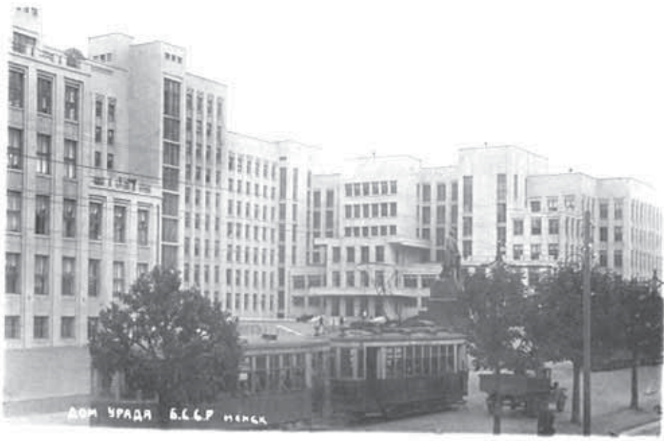
Дома ўраду ў Менску. Здымак 1941 г.