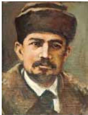
Л. Андрэевым, А. Купрыным...