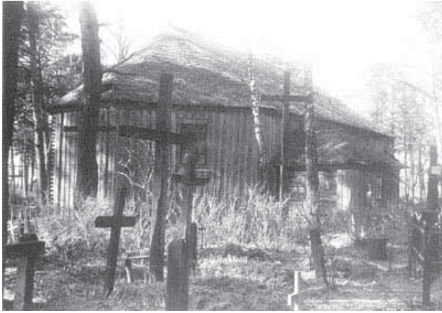
Лідскія могілкі да 1928 г.

Думаю, што нікога не можа здзівіць думка, што большасці жыхароў любога горада ўжо няма сярод нас, яны памёрлі, і мы, тыя хто жыве зараз, у нейкім сэнсе дзелім свае гарады з імі. Прычым для іх, гісторыя ўжо адбылася і ге-роі назаўжды застануцца героямі, мярзотнікі - мярзотнікамі, а звычайныя, добрыя людзі, якія заўжды былі большасцю - добрымі людзьмі. У кожным старым горадзе ёсць месцы, дзе фізічна адчуваецца прысутнасць тых, хто раней за нас нарадзіўся, любіў, ненавідзеў, па-