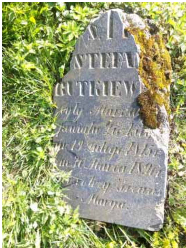
Надмагілле Стэфана Буткевіча

Ведаючы гэтую інфармацыю, сонечным красавіцкім ранкам я выправіўся на старыя могілкі, каб расшукаць магілу маршалака. Уважліва ўзіраючыся у надмагіллі я тры разы па мокрай траве абышоў тую частку могілак, дзе магілы быць магілы Буткеічаў, і нічога не знайшоў. Вырасшыўся, што магілы маршалака з жонкай знішчаны, накіраваўся да выхаду але, кінуўшы позірк на апошняе, часткова паломанае надмагілле, зразумеў, што знайшоў менавіта тое, што шукаў - магі-