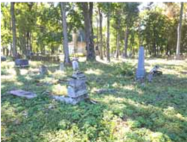
На пярэднім плане месца пахавання сямейства Андрушкевічаў

ў палон пасля паразы паўстання. Колышка быў малады чалавек гадоў 25-ці, невялікага росту, мажны, з круглым і румяным тварам. Якая была яго прафесія ў Лідзе, я не цікавіўся; здаецца, ён ... быў сынам забяспечанага абшарніка. Гэта быў гарачы ... патрыёт, цытаваў цэлыя маналогі з Міцкевіча ... Ён увесь час даставаў аднекуль памфлеты Герцана і даваў іх афіцэрам, захоплена адклікаўся пра нібыта незвычайна светлыя і здаровыя меркаванні рэвалюцыйных лістоў адносна палітычнай будучыні Расіі і Польшчы ... і ўвесь час паўтараў: "Працу вяс, спадары, не змеіваць палітычных паняццяў. Рускі народ гэта адно, а рускі ўрад - другое. Гэты апошні - наш агульны непрымірымы вораг. Абавязак кожнага патрыёта сваёй краіны - змагацца з ім, аслабляць яго, каб зрынуць тыранію, інакш Расія ніколі не вызваліцца ад унутраных кайданоў рабства. І ў гэтых адносінах рускія могуць смела разлічваць на нашу братэрскую і энергічную дапамогу".