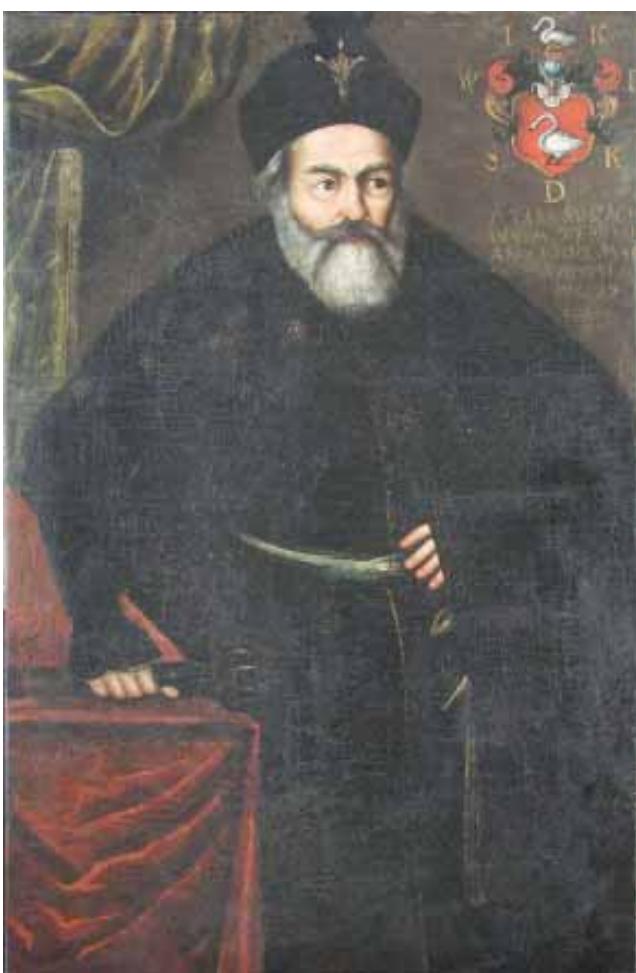
Якуб Тэадор Кунцэвіч. Партрэт 1660-х гг.