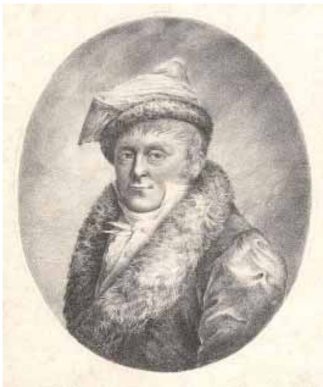
Граф Аляксандр Францішак Хадкевіч (1776-1838) у канфедэратцы. Малюнак 1822 г.

У канцы XIX ст. сярод традыцыйных галаўных убораў сялян сустракалася "капуза" - вельмі высокая і значных памераў шапка, якая шылася са скуры маладога ягняці. "Вушы" капюзы ў сцюжу завязвалі пад падбародкам, а ў цёплае надвор'е - падымалі і завязвалі зверху. Сяляне называлі