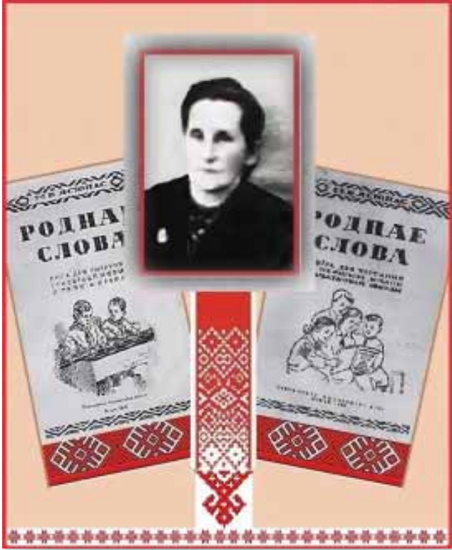
1. Η Αρχαία Σλαβική Γλώσσα...