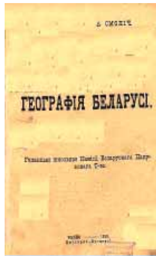
5. 'Αρχαία Σλαβική Γλώσσα'...