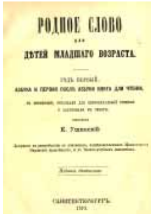
3. Η Αρχαία Σλαβική Γλώσσα...