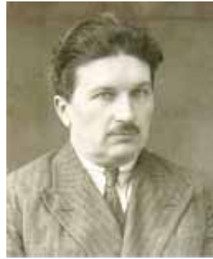
4. Ο Άγιος Κύριλλος...