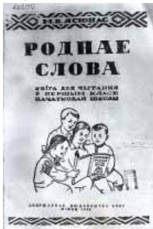
8. М. В. Ясюнас "Роднае слова". Кніга для чытання ў 1-м класе.

Пасля вайны вярнулася на Бацькаўшчыну ў Беларусь, з 1945 па 1951 год працавала завучам Пастаўскага педвучылішча. Хаця ў 1946 годзе яе чарговы падручнік "Роднае слова для 2 класа" падвергся крытыцы і да школ не дайшоў, Марыя Вікенцеўна не апусціла рук і напісала падручнік "Роднае слова: кніга для чытання ў 1 класе пачатковых школ", які вытрымаў 12 выданняў. У