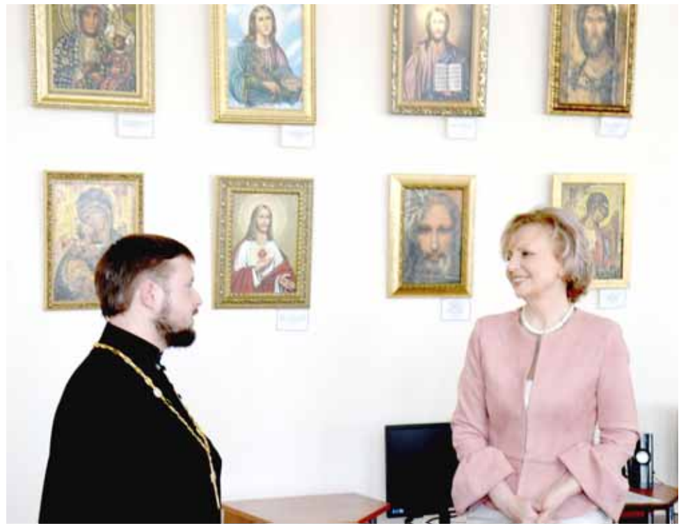
Выстава абразоў у бібліятэцы г. Баранавічы

абразоў. Я пішу алеем на палатне, бо ўпэўнена, што праца можа захавацца на 100 гадоў. Пісаць па тынкоўцы менш надзейна. Я лічу, што трэба вельмі адказна падыходзіць да сваёй працы.