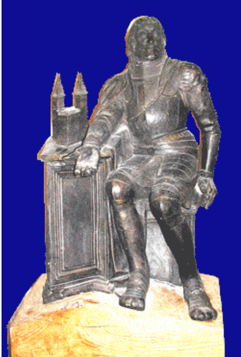
Вадзім Вераб'ёў. Заснавальнік горада Ліды вялікі князь Гедымін. Гіпс. 2001г.

Першым адгукнуўся на ідэю лідскі скульптар Вадзім Вераб'ёў. Яго дыпломная праца “Заснавальнік горада Ліды вялікі князь Гедымін” была створана ў 2001 годзе і захоўваецца ў Лідскім гістарычна-мастацкім музеі.