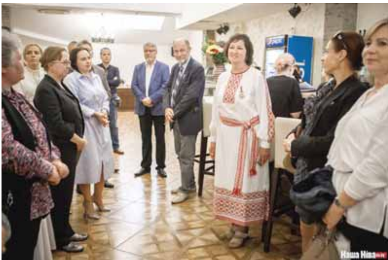
Падчас прыёму да 30-годдзя ТБМ

прафесар Беларускага інстытута правазнаўства (Менск) "Герб, сцяг, мова як гісторыка-культурная спадчына Беларускай дзяржавы і народа. Прававыя механізмы захавання і ўдасканалення";