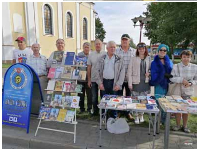
Гарадзенскія і лідскія пісьменнікі на свяце