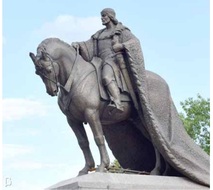
Сяргей Аганав і Вольга Нячай. Заснавальнік Лідскага замка князь Гедымін. Бронза, граніт. 2019 г.

Вольга Нячай — мастачка, скульптарка, дызайнерка, мастарка мастацтвавазнаўства. Працуе ў галіне манументальнай скульптуры, анімалістыкі, дробнай пластыкі, дэкаратыўнага мастацтва, жывапісу і дызайну. У сваёй творчасці