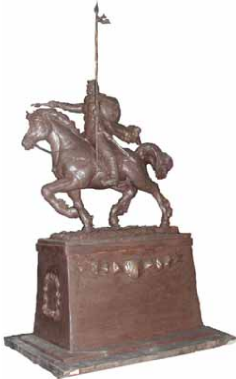
Рычард Груша. Вялікі князь Гедымін. Пластылін. 2013 г.

апявае прыгажосць коней. Нарадзілася ў Менску ў 1985 годзе.