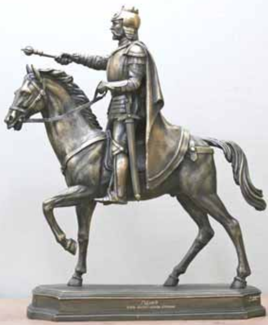
Аляксандр Лышчык. Вялікі князь Гедымін. Бронза, мармур. 2005 г.

У 2013 годзе лідскі мастак і скульптар Рычард Груша стварыў яшчэ адзін макет будучага помніка і завёз нават вялізны мармуровы блок. Але справа ізноў заціхла, і блок парэзалі на надмагільныя помнікі.