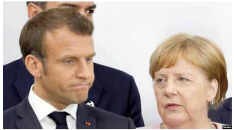
Эмануэль Макрон і Ангела Меркель

Канцлер Германіі Ангела Меркель заявіла, што захаванне звязу НАТО з'яўляецца найважнейшым прыярытэтам для краіны.