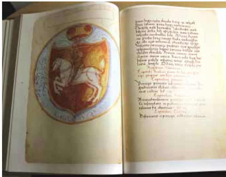
Статут ВКЛ 1529 года

цыск Скарына прыбыў у Вільню з Прагі ў 1521 годзе. Да гэтага часу яму было 52 гады, а біскупу Яну з роду Ягелонаў было прыкладна 22 гады, і ён кіраваў Віленскай епархіяй з 20-гадовага ўзросту. Рымскі папа Леў X задаволіў гэты капрыз ў дачыненні да сына польскага караля (у той час студэнта Балонскага ўніверсітэта). Пры гэтым усю паўнату духоўнай улады Ян атрымаў толькі праз 7 гадоў, прыняўшы духоўны сан.