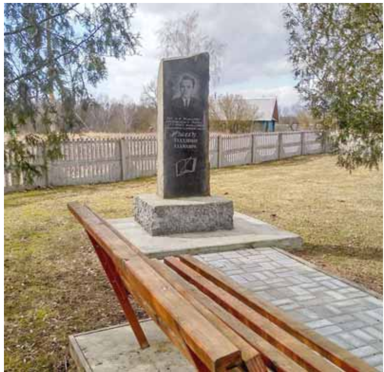
Помнік У. Жылку ў Макашах

Яшчэ адзін пункт юбілейнага плана Жылкі, які выклікаў зацікаўлены водгук бакоў, - каб 2020 год стаў першым годам тра-