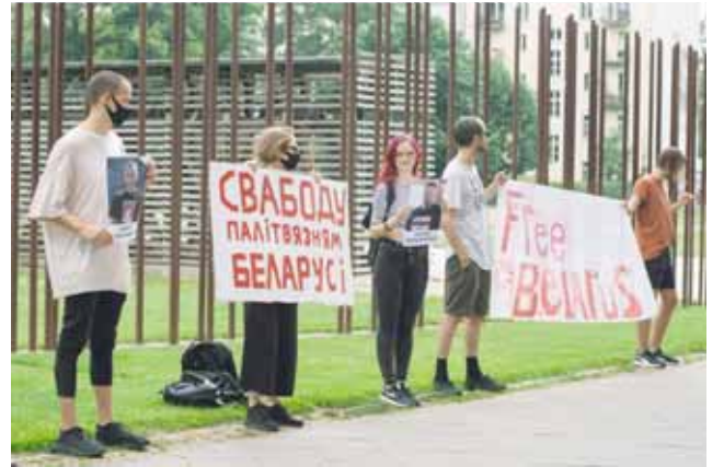
Акцыя ў Берліне