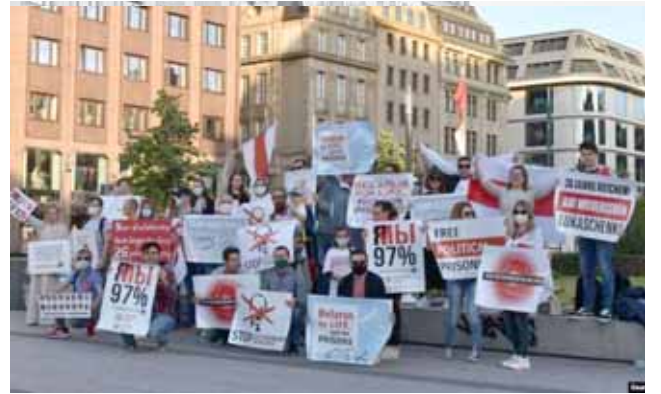
Акцыя ў Дзюсельдорфе