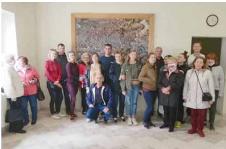
Каля карціны "Аршанская бітва"

роды, які не характэрны для нашых мясцінаў - гэта велізарны валун памеры якога 2,5 на 8 метраў. Мы ўсёй грамадой з задавальненнем на гэты гіганцкі валун залезлі, а потым, праўда некаторыя думалі, а як жа з яго злезці!?