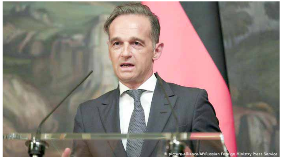
Кіраўнік МЗС ФРГ Хайка Мас