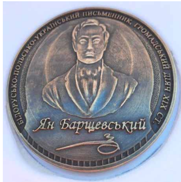
Медаль Яна Баршчэўскага