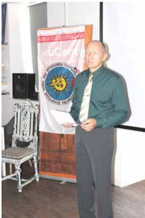
міжнародных арганізацый для з'езду. У канферэнцыі браў удзел намеснік