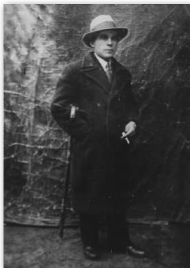
Георгі Іосіфавіч Шагун (1903–1960), адзін з кіраўнікоў паўстання. 1936 г. (з асабістага архіва М. І. Дзеляноўскага).