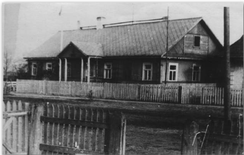
Будынак, дзе месціўся скідзельскі паўстанцкі рэўкам. Здымак 1966 г..