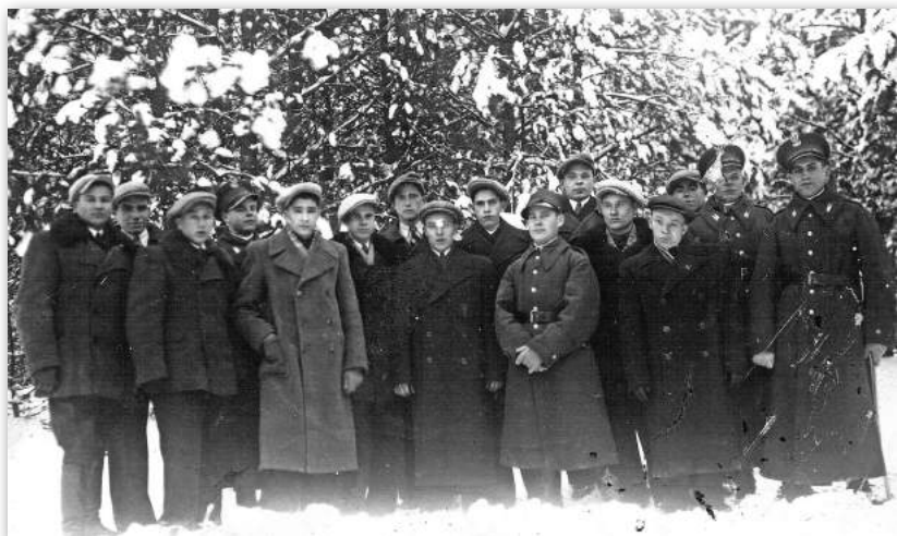
Скідзельская моладзь на Каляды 1939 г..