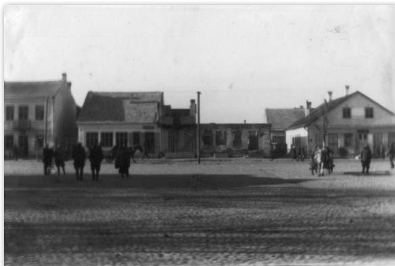
Плошча Скідзеля пасля паўстання.