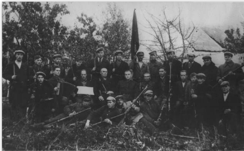
Калектыўны фотаздымак скідзельскіх паўстанцаў. Зроблены праз некалькі дзён пасля падзей паўстання (з асабістага архіва М. І. Дзеляноўскага).