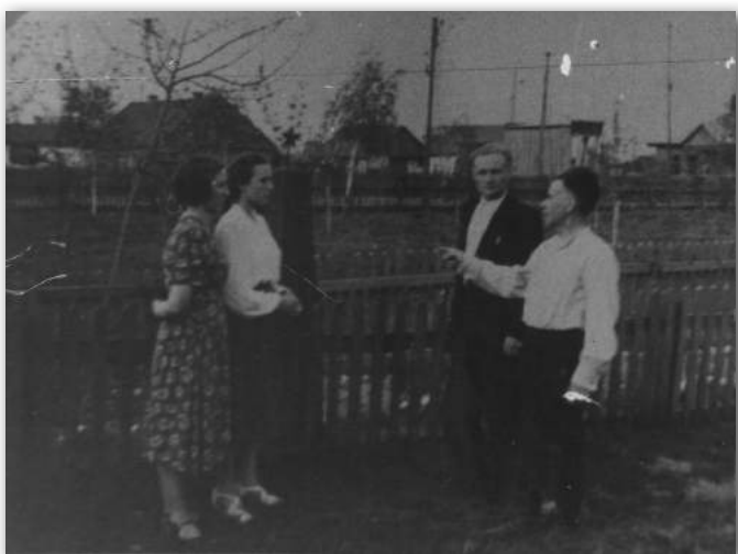
Брацкая магіла паўстанцаў 1939 г. у цэнтры Скідзеля. Здымак зроблены ў пасляваенныя гады. Пазней парэшткі паўстанцаў перазахавалі ў магілу Невядомага салдата.