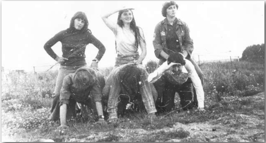
Студэнты філасофскага аддзялення БДУ адпачываюць пасля працы ў будаўнічым атрадзе імя Францішка Скарыны. 1979 год, вёска Сціклева, Мінскі раён.