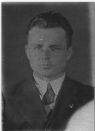
Міхал Іванавіч Літвін (1914–1941), адзін з кіраўнікоў паўстання.