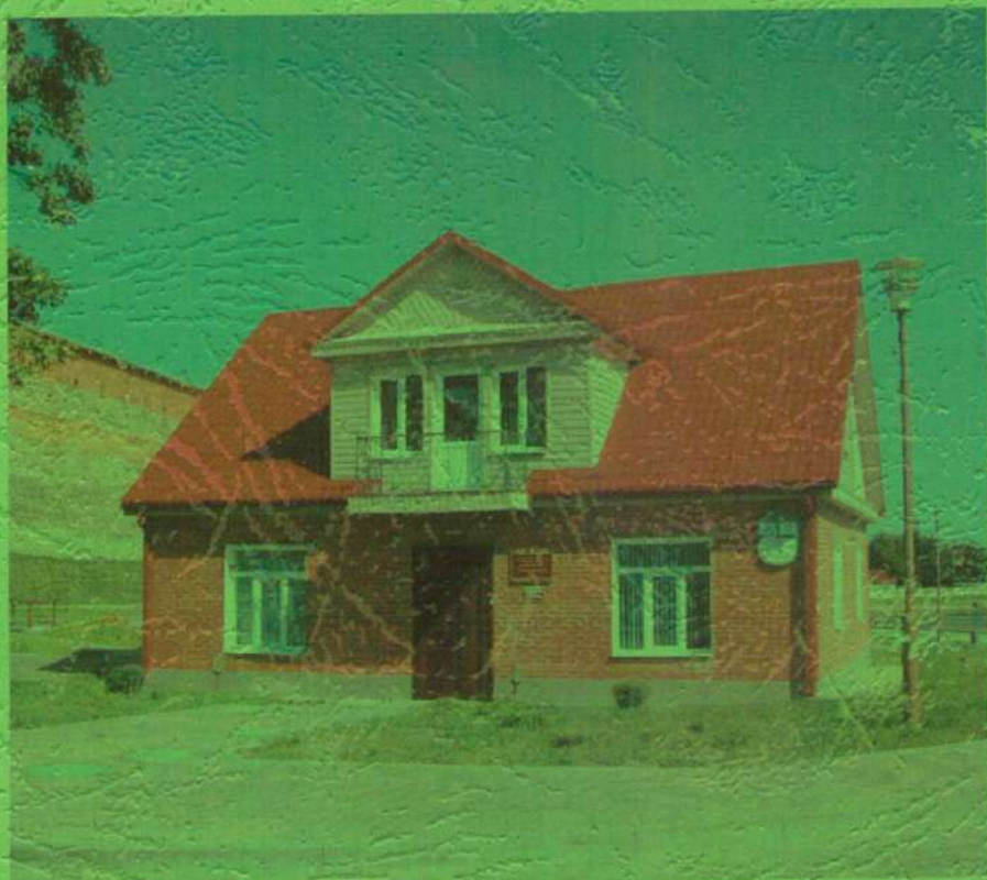
Дом Таўлая ў Лідзе. Здымак 2011 г.