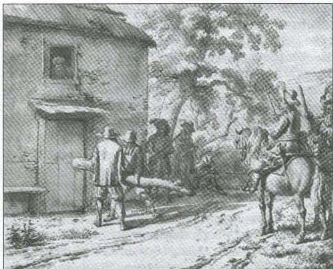
Жаўнеры ламаюць дзверы хаты. Малюнак Адрыяна ван дэ Вельдэ. 1669 г.

ва да пачатку вясны 1708 г.: "тых, хто не мог схавацца, мучылі, білі, пяклі, кожны мусіў пра сваё апошняе дабро распавесці і аддаць" 32 .