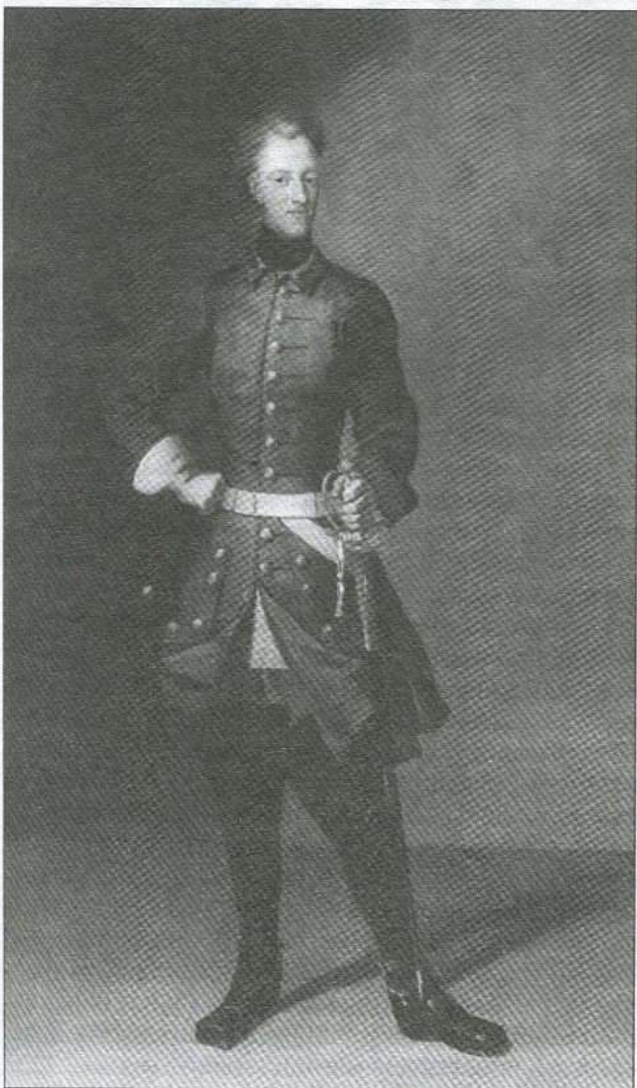
Шведскі кароль Карл XII. Партрэт Давіда фон Крафта. 1707 г.

скіх марскіх дзяржаў — Англіі і Нідэрландаў, Карл XII спланаваў дзёрзкую аперацыю з мэтай нанесці ўдар у самае сэрца Дацкага Каралеўства. Шведская армія на чале з каралём высадзілася на востраве Зеландыя і ўзяла ў аблогу сталіцу Даніі Капенгаген. У выніку Данія была вымушана пайсці на падпісанне сепаратнага мірнага пагаднення і выйсці з вайны са Швецыяй. Карл XII адзначыў: "Я вырашыў ніколі не весці несправядлівай вайны, а толькі справядлівую і заканчваць яе згубай непрыяцеля. Я нападу на першага, хто аб'явіць мне вайну, а калі атрымаю над ім перамогу, гэтым, спадзяюся, застрашу іншых" 2 .