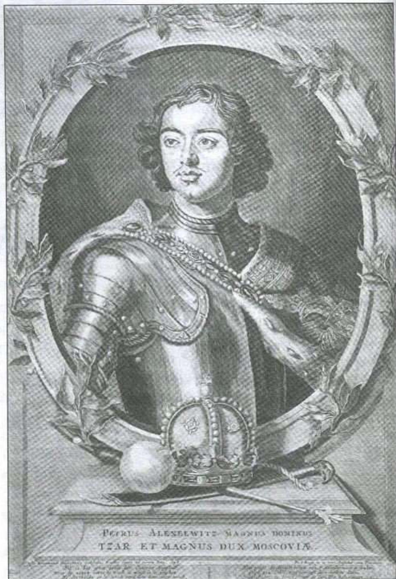
Расійскі цар Пётр I. Гравюра Пітэра ван дэн Берге паводле карціны Готфрыда Кнелера. 1698 г.

Паколькі паход саксонскіх войскаў на Рыгу ў 1700 г. адбыўся з тэрыторыі Рэчы Паспалітай, Карл XII лічыў, што мае поўнае права ўступіць на яе тэрыторыю. Ён збіраўся звергнуць Аўгуста II, прывесці да ўлады прыхільнага да Швецыі манарха і ўцягнуць Рэч Паспалітую ў вайну з Расіяй. Для рэалізацыі гэтых планаў шведы пачалі пошук прыхільнікаў сярод палітычнай эліты краіны. Першымі на іх бок перайшлі Сапегі, якія імкнуліся аднавіць свае пазіцыі ў ВКЛ. Іх