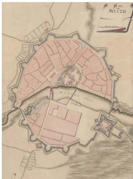
Малюнак 2. План Слуцка, пачатак XVIII ст. (Я.Г.М. фон Фюрстэнхоф)

Аб тым, як аплочвалася праца валмайстра, можна меркаваць па заробку Ганса Бэка. Найбольшую сумму за год немец атрымаў у 1664 годзе, калі з касы князя яму было выплачана 208 злотых 38 [38, s.106]. У наступным годзе за будаўнічы сезон (з 1 красавіка па 1 кастрычніка) Бэк атрымаў 133 злотых [30, s. 2, 5]. З заканчэннем будаўнічага сезону заробак валмайстра мог значна зніжацца. За працу на гарадскіх фартыфікацыях Бэк атрымліваў па 3 злотых за тыдзень, пры гэты нягледзячы на загад князя выплочваць заробак валмайстру цэлы год горад адмаўляўся плаціць яму з заканчэннем будаўнічага сезону [1, s. 175, 191]. Паводле парадку платы слуцкаму гарнізону, уведенаму з 1 снежня 1671 года валмайстр, якім, відаць, па-ранейшаму заставаўся Бэк, павінен быў атрымліваць 111 злотых грашыма і 36 злотых прадуктамі [32, s. 9; 33]. На думку У. Пярвышына, у сярэдзіне – другой палове 1670-ых гадоў Бэк, які і дэ ля Вале, пераехаў у Нясвіж [33, с. 122].