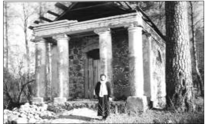
Kaplica nagrobna w Naczy przed rekonstrukcją stan 2004 r.