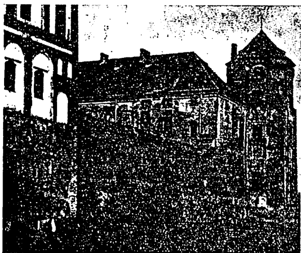
Wygląd obecny zamku.

Gdy w listopadzie 1812 r. admirał Czyczagow na czele południowej armii posuwał się na Mirsk, mając na celu przecięcie odwrotu armii napoleońskiej, doszło pod Mirem do krwawej bitwy z oddziałami kawalerii gen. Dąbrowskiego. Po zajęciu Mira Rosjanie, mszcząc się na walczącym pod orłami napoleońskimi ordynacje Mirszczyzny, ks. Dominiku Radziwille, splondrowali doszczętnie zamek. Zrabowano wówczas piękne lustra i brzozy, pozdzierano