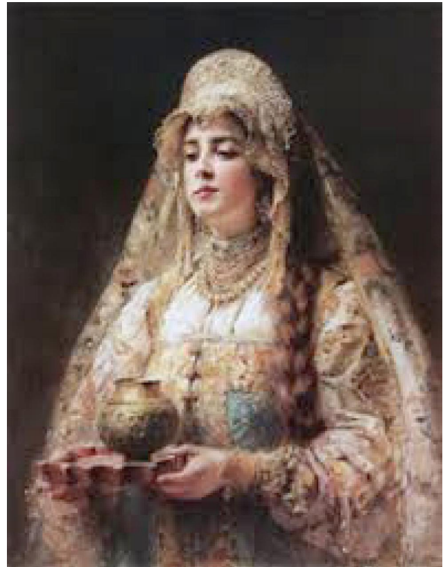
Вялікая літоўская княгіня Алена

Аляксандр адразу адчуў моцнае расчараванне. Шлюб з Аленай адбыўся ў 1495 г., аднак ён не прынёс такога патрэбнага для Літвы спакою з Масквой. Перад усім Іван Васільевіч не заплаціў запісанага ў дамове пасагу, і Алена прыбыла ў Вільню, не маючы нават патрэбнага адзення, якое ёй быў вымушаны купіць малады муж, каб яна не кампраматавала вялікага князя, бо сама стала ўжо