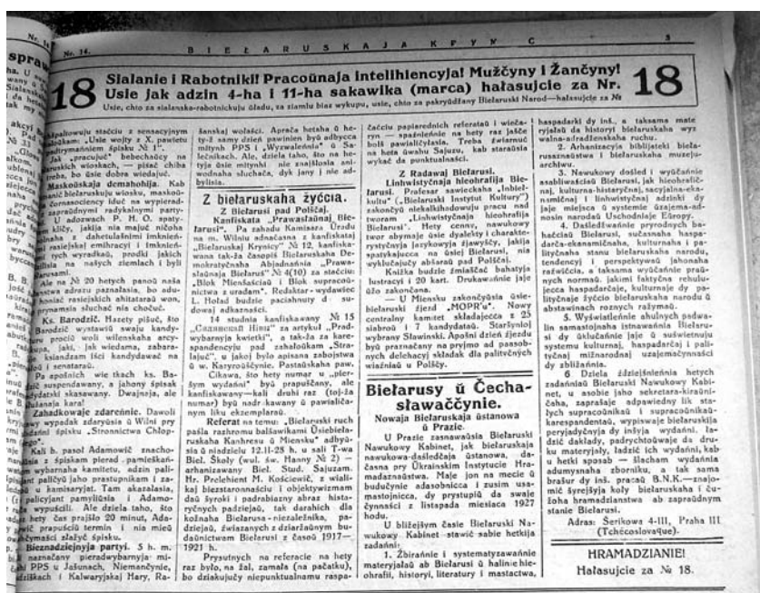
Старонка з газеты "Беларуская крыніца", на якой змешчана заметка пра дзейнасць БНК. Вільня, 1928 г.