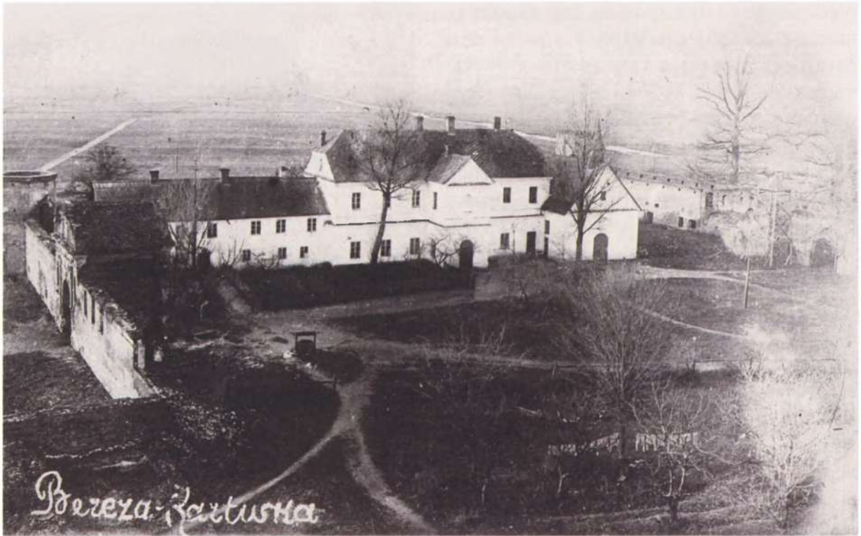
Будынкi былога кляштара картузаў. Бяроза, 1920–30-я гг.