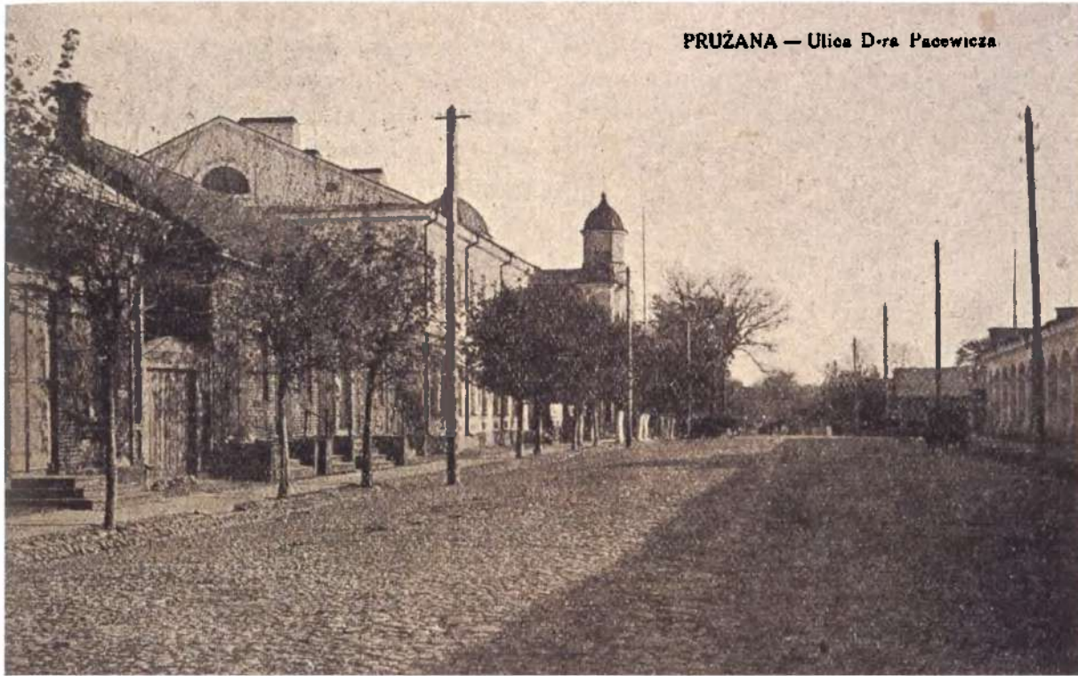
Вул. Пацэвіча ў Пружанах. 1920-я гг. Нацыянальная бібліятэка ў Варшаве