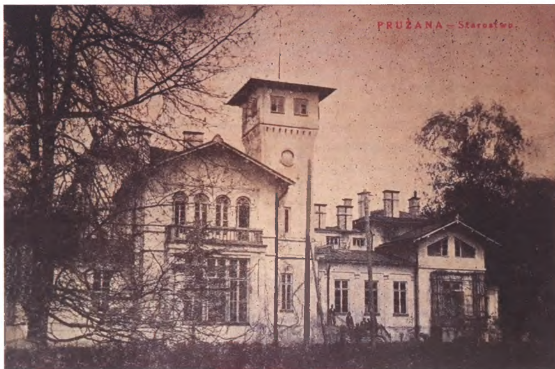
Будынак староства. Пружаны, 1920–30-я гг.

кніг, улётак. Частка мясцовай моладзі, якая знаходзілася пад яе ўплывам, а таксама ўсе яе родныя дзеці, паступілі вучыцца ў Віленскую беларускую гімназію і, такім чынам, далучыліся да арганізаванага нацыянальнага руху. У жніўні 1925 г. Кацярына Стаўбунік была арыштавана разам з 200 іншымі мясцовымі актывістамі па абвінавачванні ў «камуністычнай дзейнасці» і паўгода правяда за кратамі Гродзенскай турмы [39]. Яна мела добрыя сувязі з Рыгорам Шырмай і фактычна, дзякуючы іх грамадскаму дуэту, беларускі рух у Пружанскім павеце глыбока пранікаў у сялянскае асяроддзе. На гэты конт польская паліцыя паведамляла: «Стаўбунік і Шырма маюць вельмі шырокія кантакты з жыхарамі навакольных вёсак, якія знаходзяцца пад іх унлывам... Дзякуючы шматгадовай дзейнасці Стаўбунік на тэрыторыі Пружанскай і суседніх гмінаў зараз маецца значны працэнт нацыянальна