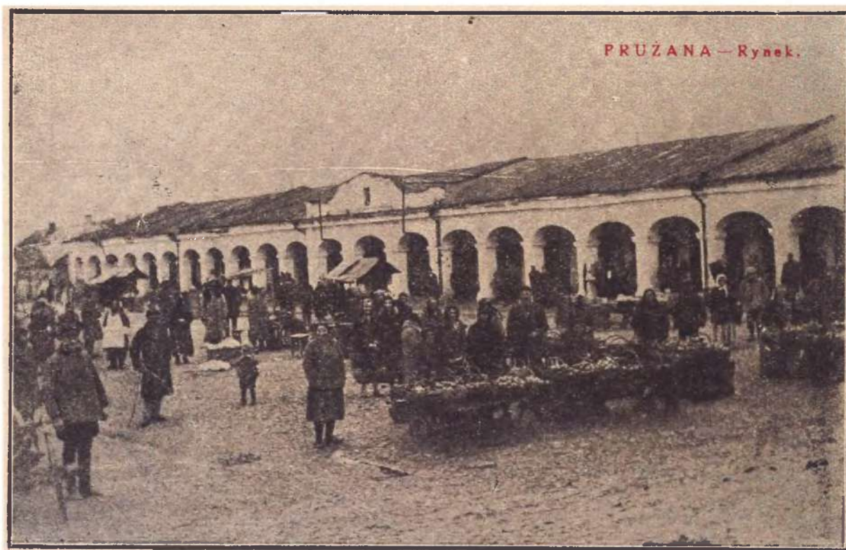
Рынкавая плошча. Пружаны, 1920-я гг.

кага насельніцтва, прынамсі, з пункту гледжання польскай статыстыкі. Разу-меючы палітычную ангажаванасць гэтай статыстыкі, якую прызнавалі нават польскія спецыялісты, вызначыць дакладную колькасць людзей з беларускай ідэнтычнасцю на сённяшні час вельмі складана. Падчас першага перапісу насельніцтва Расійскай імперыі 1897 г. у тагачасным Пружанскім павеце налічвалася 75,5 % беларусаў, 6,7 % украінцаў і 1,4 % палякаў [1, с. 102]. Аднак ужо пасля Першай сусветнай і польска-савецкай войнаў польская адміністрацыя, якая пачала кантраляваць абшары Пружаншчыны, значна заніжала долю беларусаў і павышала працэнт польскага насельніцтва. Па польскім перапісе 1921 г. у Пружанскім павеце налічвалася ўжо 46 % беларусаў (30 107 чалавек) і 44 % палякаў (28 448 чалавек) [2, с. IX]. Беларускі географ А. Смоліч, аналізу-