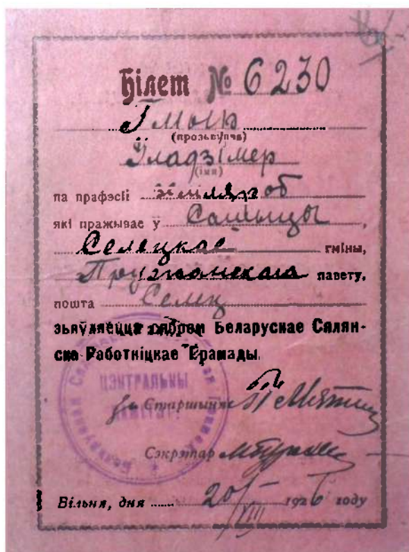
Билет сябра Беларускай сялянска-работніцкай грамады У. Гмыра. 1926 г. Цэнтральны дзяржаўны архіў Літвы