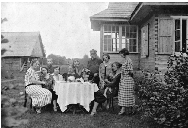
Перад леснічоўкай у Гарнях, 1920-я гг.