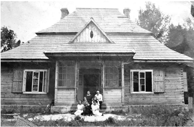
Леснічоўка ў Гарнях, 1920-я гг., на ганку ляснічы Зыгмунт Развадоўскі з сям'ёй