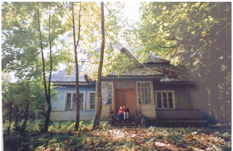
Былая леснічоўка ў Гарнях, калі не памыляўся, недзе да 2005 г. у гэтым будынку працавала пачатковая Гарнянская школа.