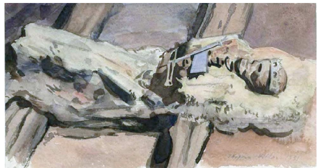
Парэіткі Барбары з Радзівілаў, малюнак прафесара Ежы Хопена

ваўся ад надпісу на вечку труны, з яго можна было даведацца, што ў тут ляжыць каралева Барбара, другая жонка караля і вялікага князя, якая памерла 8 траўня 1551 г. Карона, скіпетр і інсывініі з-за старажытнасці пакрыліся пацінай.