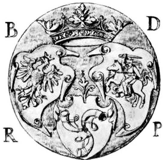
Медальён з трыма гербамі, знойдзены ў магіле Барбары з Радзівілаў

Трэба павярнуцца і ўваходзіць у яму задам. На ўваходзе ўстаноўлены жалезныя дзверы. Напаўсяпое трывожнае электрычнае святло. Першае, што кідаецца ў вочы - зелень чэрапа караля Аляксандра. Потым бачыш карону на чэрапе, потым зрок прызвычайваецца, і бачыш голень, бачыш рэшткі шкілета. Час ад часу, у блукаючым святле лямпы, будзе кідацца ў вочы парча на труне Барбары з Радзівілаў - такая выразная, такая прыгожая і такая шляхетная, ці дакладней фрагмент