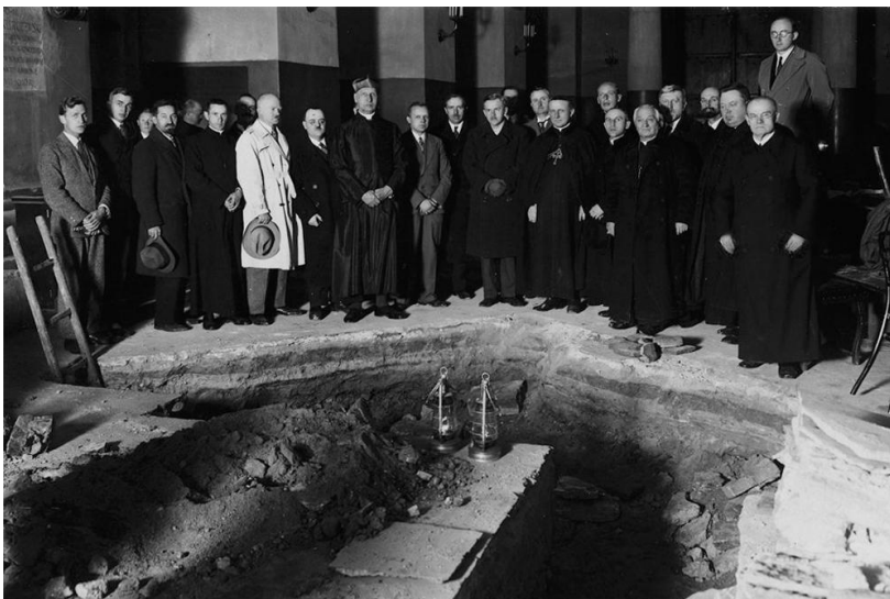
Каля кралёўскай крыпты ў Вільні, 22 верасня 1931 г.