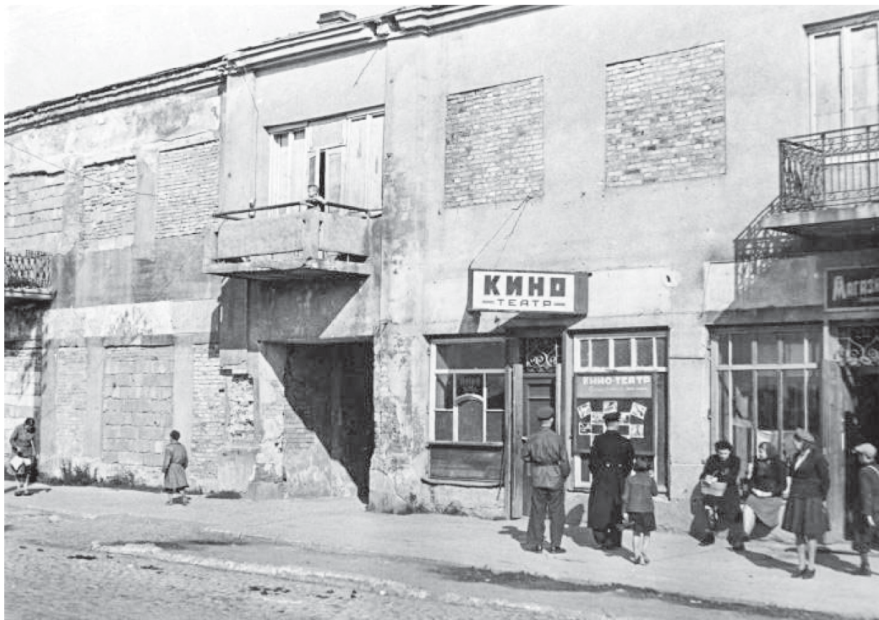
Кінатэатр у доме па Савецкай, 16 (1950-я гады).