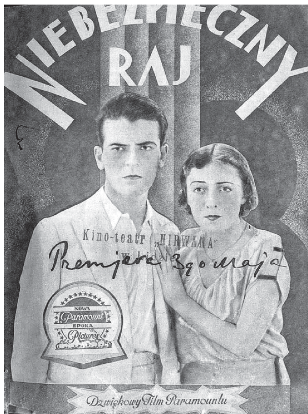
Рэклама фільма ў кінатэатры «Нірвана», 1930-я гг.

Жыхар горада Ян Станіслаўскі лічыў, што лепшым кінатэатрам горада быў менавіта «Эдысан»: «Уладальнік гэтага кінатэатра меў плямы на твары з-за ўзгарання кінастужкі... Знутры кінатэатр меў прыгожы выгляд. У фае крэслы абабіты чырвоным аксамітам. Квіткаркі хадзілі ўбраныя ў чырвоныя з жоўтымі лацканамі ліўрэі, штаны з жоўтымі лампасамі і ў чырвоных высокіх шапках» 41 .