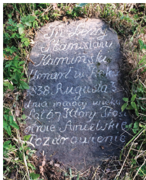
Надмагілле Станіслава Камінскага на могілках Навагрудка (фота аўтара, чэрвень 2019). Надпіс на пліце: «Tu leży Stanisław Kaminski. Umarł w roku 1838 augusta 3 dnia, mający wieku lat 67. Ktory prosi o troje anielskie pozdrowienie».