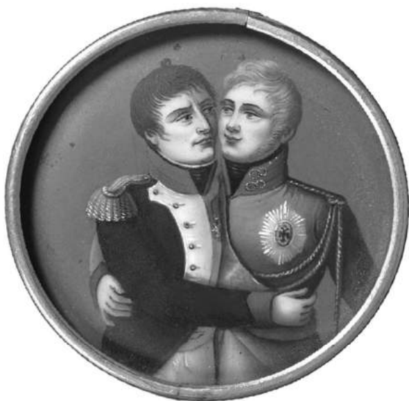
Медальён з выявай Напалеона і Аляксандра.

папулярным. Такім чынам як бы падкрэслівалася лаяльнасць да Расіі і забяспечвалася пэўная страхоўка ад падазрэнняў у магчымай нядобранадзейнасці. Зрэшты, пасля таго як 13 (25) ліпеня 1807 г. у прускім горадзе Тэльзіце быў заключаны мір, які юрыдычна зрабіў Расію саюзніцай Францыі, такая форма імя стала цалкам "трэндавай" і рэспектабельнай, прынамсі да пачатку кампаніі 1812 г.