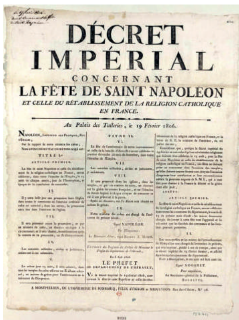
Дэкрэт імператара Напалеона I аб свяце ў гонар святога Напалеона і ўзнаўленні каталіцкай рэлігіі ў Францыі. 19 лютага 1806 г.