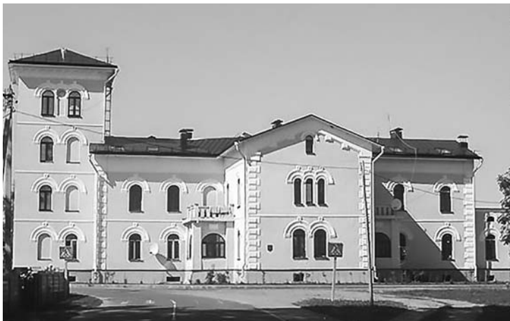
Палац Маўрасаў у Тарнова.