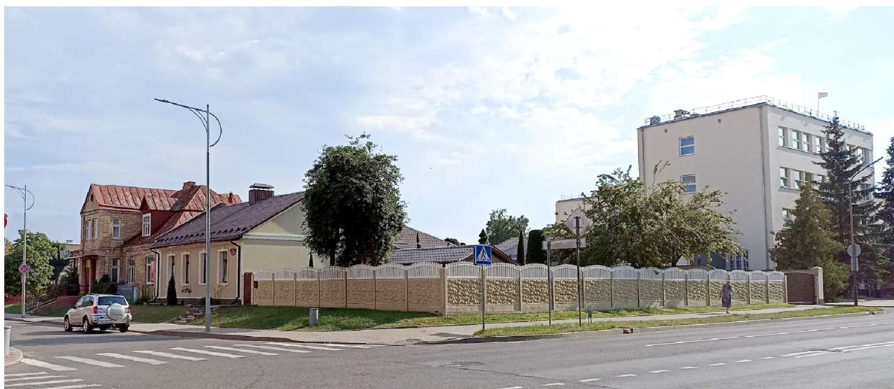
Дом № 2 на вуліцы 7-га Лістапада, дом № 4 і гарадская пошта, ліпень 2023 г.

Зямлю на Выгане павінны былі пачаць прадаваць яшчэ да Першай сусветнай вайны, і на карце горада 1914 г. тут ужо пазначаны будучыя вуліцы. Газета "Лідскае Слова" пісала ў 1913 г.: "Ужо некалькі гадоў кажуць