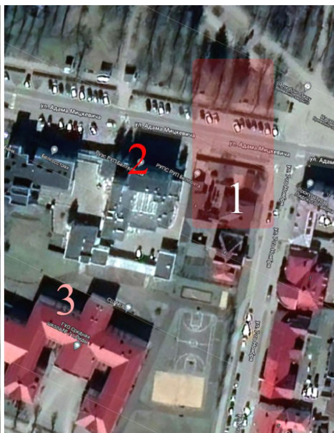
"Ліда Нарбута" на аэрафотаздымку красавіка 1944 г. і сучасным здымку з гугль-карты.

1 - Дом Мар'яна Міхальчыка № 2 на вуліцы 11-га Лістапада (7-га Лістапада), 2 - Лідская пошта на вуліцы Міцкевіча, 3 - Школы № 1 і № 2, сучасная школа № 1.