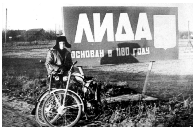
Указальнік на ўездзе ў г. Ліда ў 1970-я гг.

пра тое, што Выган падзелены на ўчасткі, якія будуць прадаваць з гандляў. Але гэтага не робіцца". І яшчэ ў 1909 г. гарадскому старасце было даручана забрукаваць Школьную вуліцу (зараз - Кірава) да Выгана.