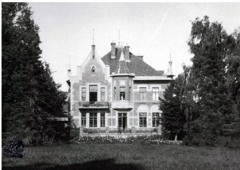
Дом у Лябёдцы, 1930-я гг.

для будаўніцтва старавасішкаўскага касцёла і лябёдскага палаца прывозілі з польскага Влацлавека.